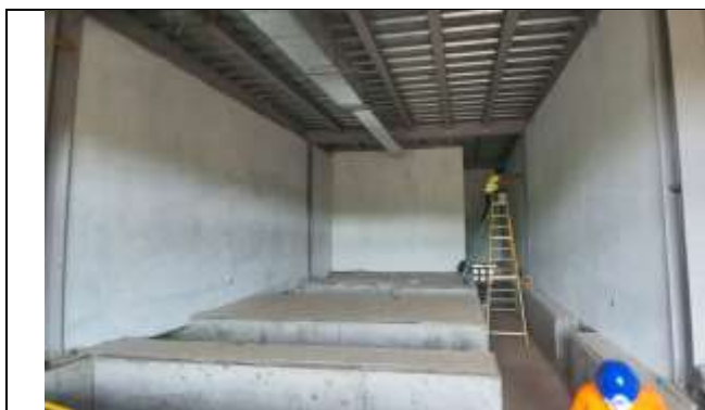
Foto # 1 , Pintura base de paredes internas de la casa control en Subestación Llano Sánchez.