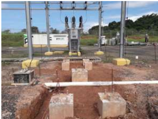
Foto # 1, Fundaciones del patio de 34.5 kV en Subestación Llano Sánchez.