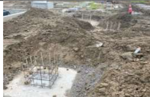
Foto # 10, Demolición de pedestales de soporte de 22.2 kV en Subestación Panamá II.