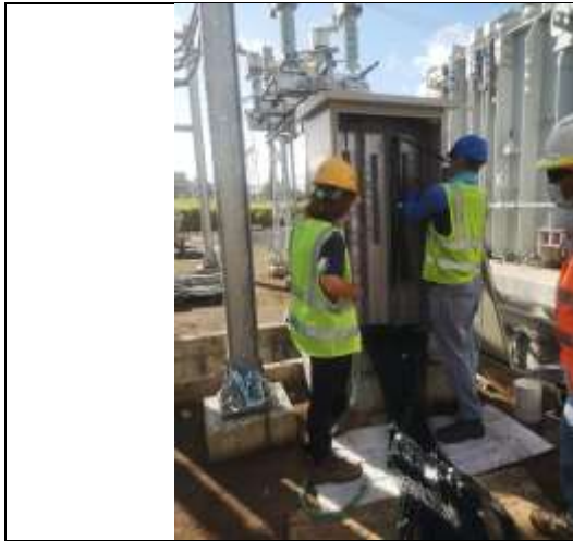
Foto # 3, Conexión de MK02 en Subestación Llano Sánchez.