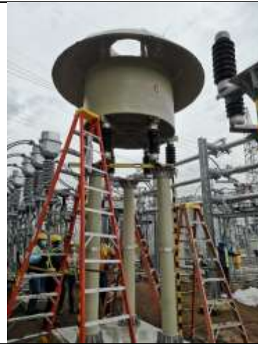
Foto # 4, Instalación de reactor en Subestación Llano Sánchez.