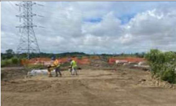
Foto # 7, Trabajos de relleno y compactación pórtico 1 en Subestación Panamá II.