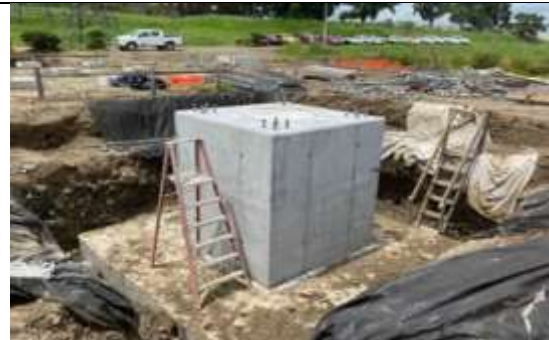
Foto # 8, Desencofrado de pedestal pórtico 3 en Subestación Panamá II.