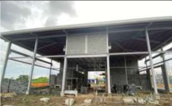
Foto # 9, Casa control en trabajo de bloqueo en Subestación Panamá II.