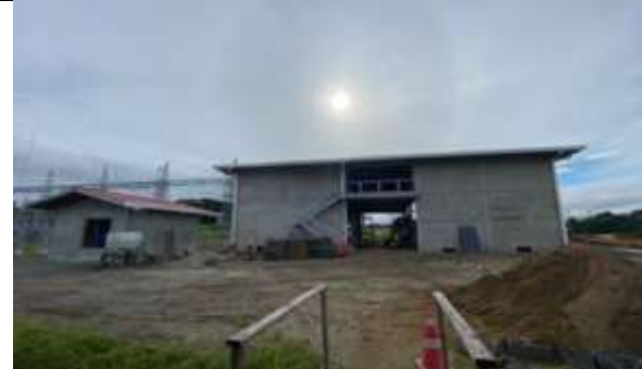
Foto # 6, Vista del eje D de casa Control repellado en Subestación Panamá II.