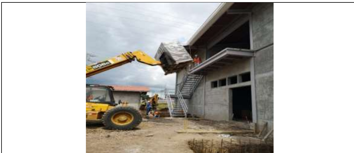
Foto # 1, Entrega de las manejadoras de aire acondicionado en S/E Llano Sánchez.