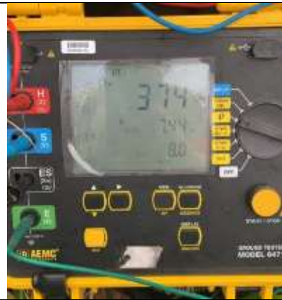
Foto # 6, Medición de la resistividad del terreno en la torre 81.