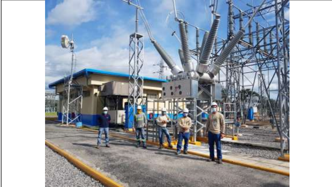
Foto # 1, Puesta en servicio del interruptor 23A22 en la S/E Progreso.