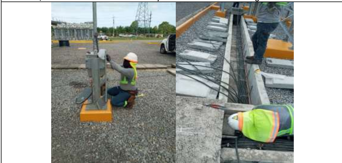
Foto # 2, Tendido de cables desde patio hasta la casa control en la S/E Progreso.