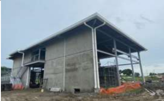
Foto # 5, Instalación de bajantes pluviales en Subestación Panamá II.