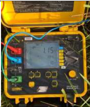
Foto # 5, Medición de la resistividad del terreno en la torre 49.