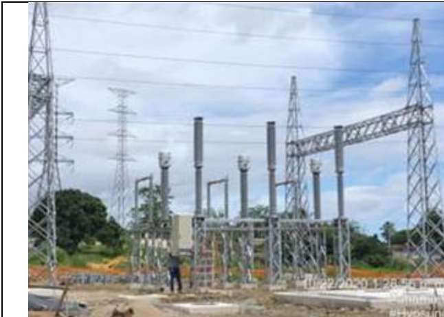
Foto # 5, Trabajos en el patio de la Subestación Panamá II.