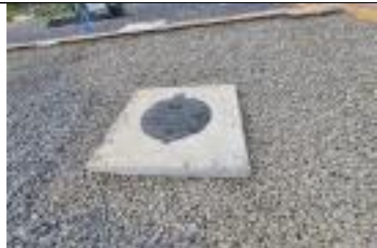
Foto # 2 , Relleno, compactación, regado de piedra y colocación de tapa en cámara de vigaducto Subestación Llano Sánchez