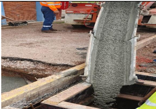
Foto # 1 , Vaciado de cámara para nueva entrada de casa control en Subestación Llano Sánchez.