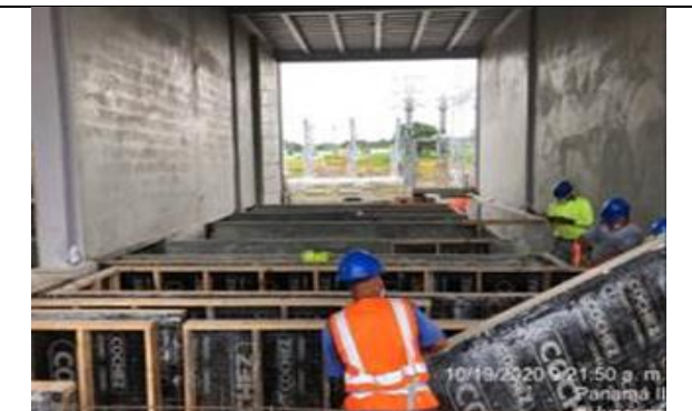
Foto # 10, Trabajos realizados en casa control en Subestación Panamá II.