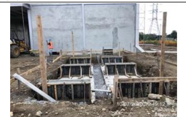
Foto # 8, Fundaciones de Heat Exchanger en Subestación Panamá II.