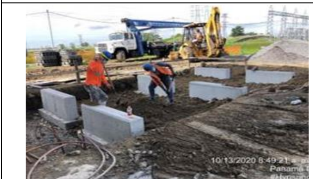
Foto # 9, Fundaciones de Heat Exchanger en Subestación Panamá II.