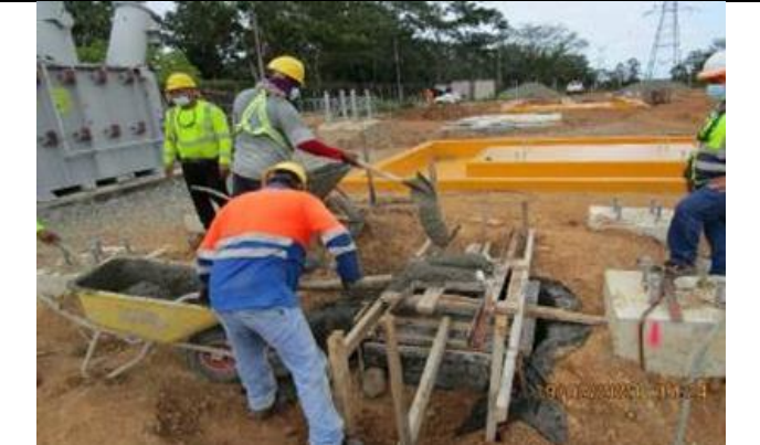
Foto # 5, Preparación de base para soporte de gabinete en interruptor de tanque muerto en S/E Changuinola.