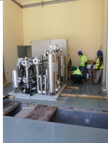
Foto # 2, Instalación de equipos del sistema de enfriamiento en subestación Llano Sánchez.