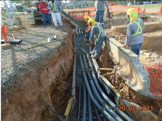
Foto # 3, Vaciado de vigaducto de Potencia de 34.5kV en subestación Chorrera.