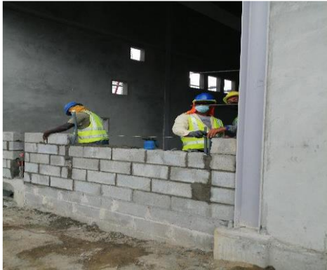
Foto # 7, Bloqueo de pared exterior valve hall 2 en subestación Panamá II.