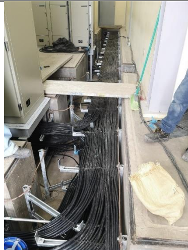
Foto # 4, Cableado en cuarto control en subestación Llano Sánchez.