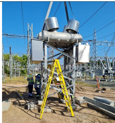
Foto # 2, Colocación de interruptor de 230 kV en subestación Panamá.