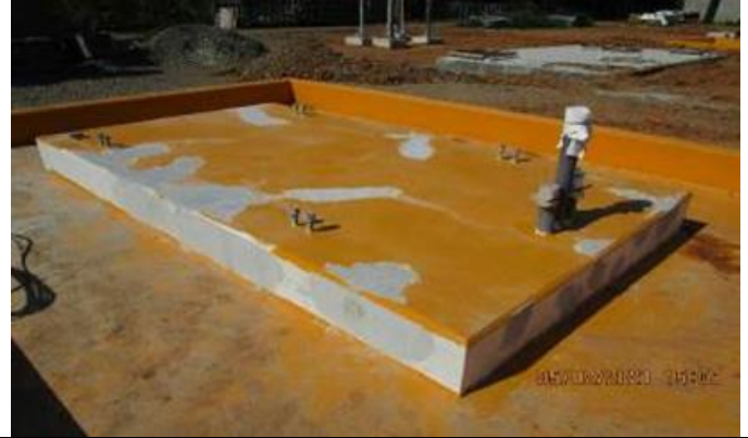
Foto # 3, Desencofrado de muros de canaleta 3A en subestación Changuinola.