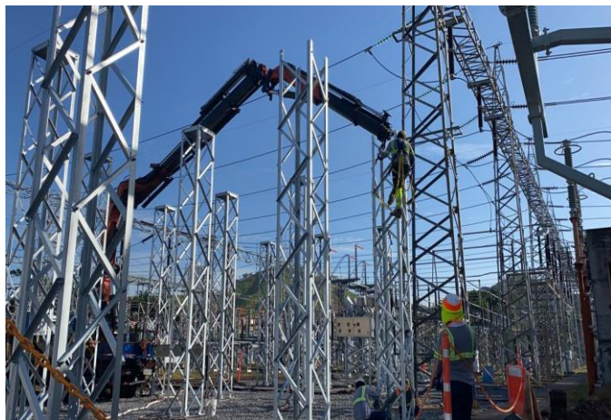
Foto # 1, Montaje de estructuras metálicas en subestación Panamá.