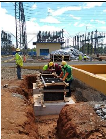
Foto # 3, Formaletas en pedestales de seccionador de 34.5 kV en subestación Mata de Nance.