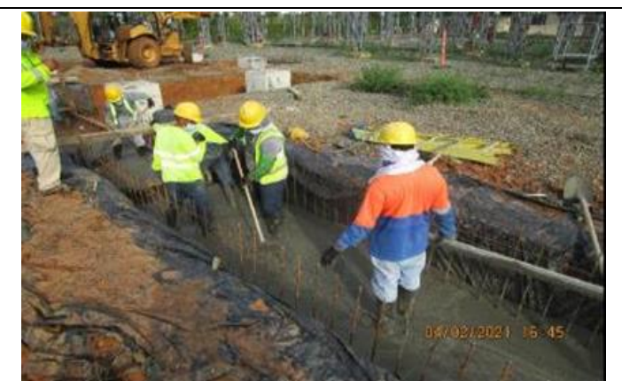
Foto # 1, Vaciado de concreto en la parte final de la canalera tipo 3A en subestación Changuinola.