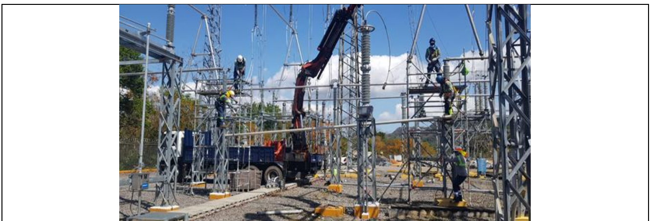
Foto # 1, Interconexión de los tramos de barra A en subestación Mata de Nance.