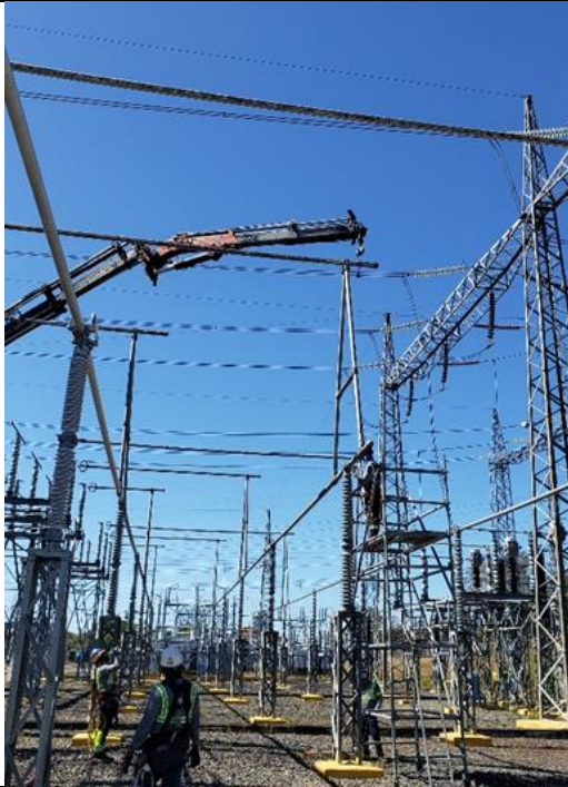
Foto # 2, Interconexión de los tramos de barra B en subestación Mata de Nance.