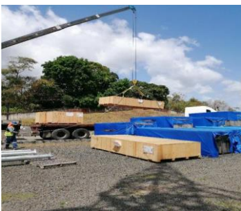
Foto # 5, Entrega del sistema de enfriamiento en subestación Panamá II.