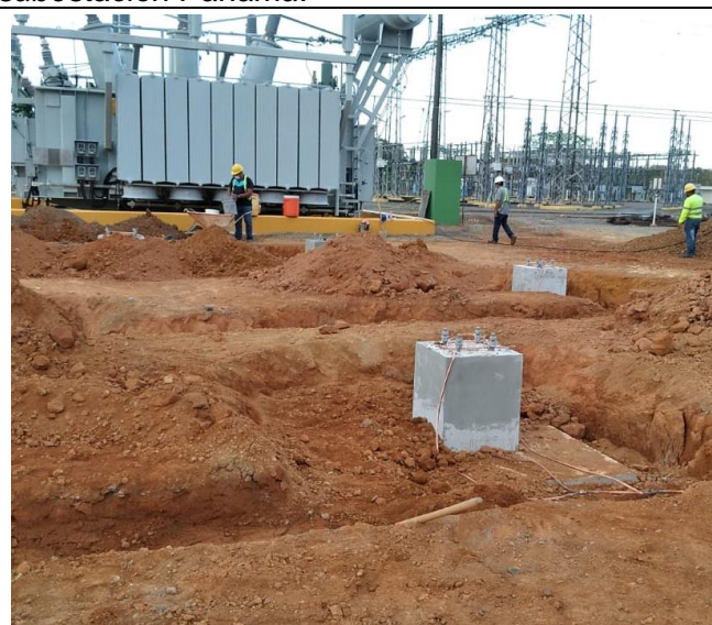
Foto # 4, Pedestales de aisladores de barra de 230kV en subestación Mata de Nance.