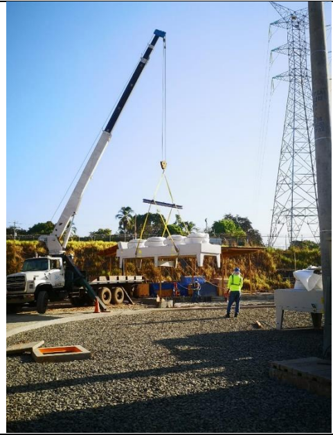
Foto # 2, Entrega de algunos materiales en la subestación Llano Sánchez.