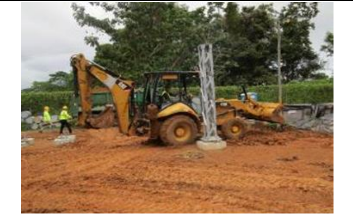
Foto # 7, Excavación de zanja para drenaje en subestación Changuinola.