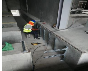
Foto # 6, Colocación de bastidores de soporte para cables en canaletas casa control en subestación Panamá II.