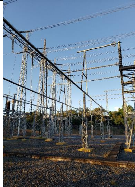
Foto # 3, Interconexión de los tramos de barra B en subestación Mata de Nance.