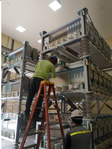
Foto # 1, Instalación de equipos en Valve Hall en subestación Llano Sánchez.