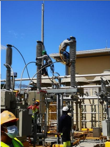
Foto # 3, Pruebas a interruptores de potencia en subestación Llano Sánchez.