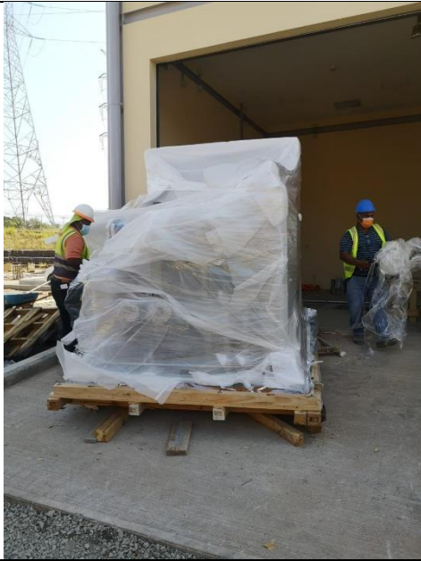
Foto # 1, Entrega de algunos materiales en la subestación Llano Sánchez.