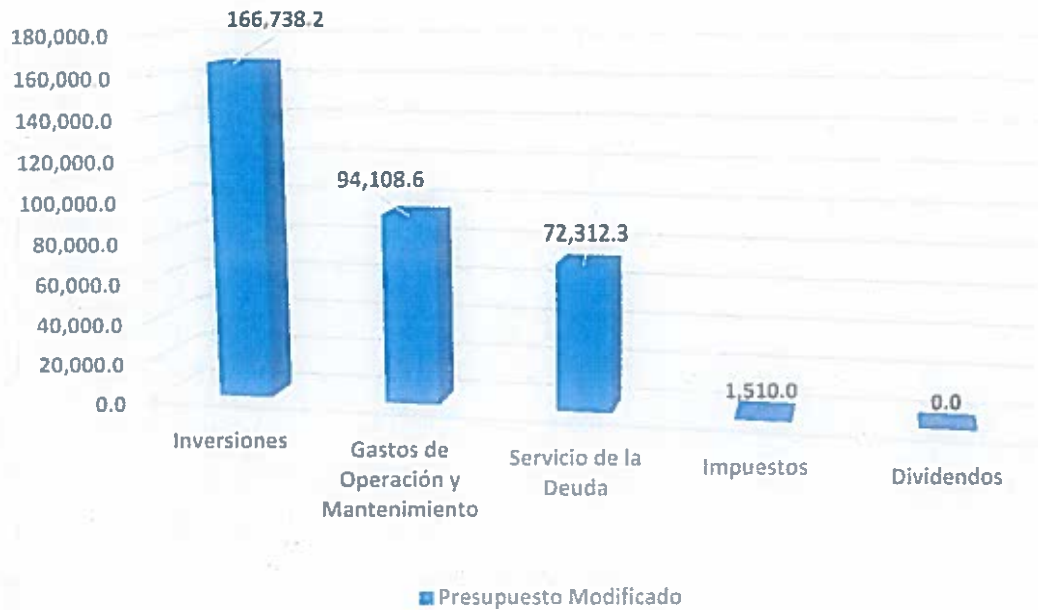
Gráfica No. 1 Presupuesto Modificado a agosto 2019