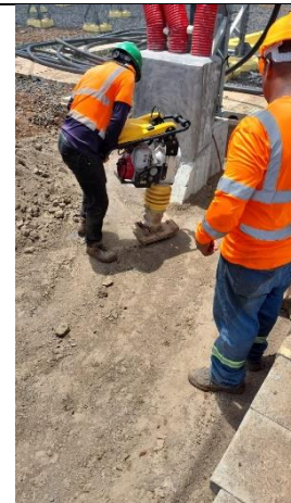
Foto # 6, Compactación del área de trabajo en la Subestación Llano Sánchez.