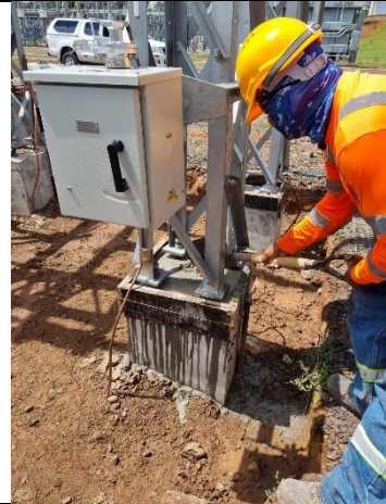
Foto # 4, Colocación del grounding en los pedestales la Subestación Llano Sánchez.