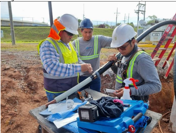
Foto # 7, Preparación de los terminales de los cables MT en la Subestación Llano Sánchez.