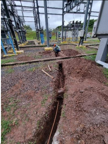
Foto # 3, Vista de la malla de puesta a tierra de los equipos de la Subestación Llano Sánchez.