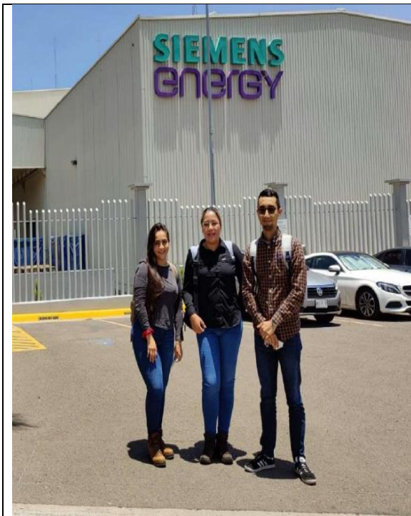
Visita de Ingenieros de ETESA y ELEC NOR a la fábrica de Siemens en Santiago de Querétaro, México