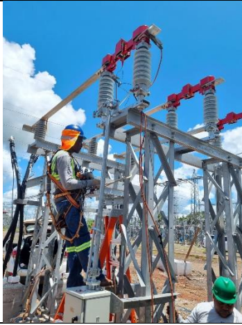
Foto # 9, Trabajos de preparación de ángulos en la Subestación Llano Sánchez.