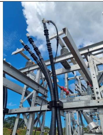
Foto # 8, Preparación de los terminales de los cables MT en la Subestación Llano Sánchez.