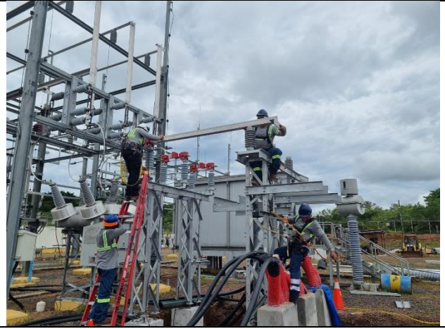
Foto # 10, Trabajos de preparación de ángulos en la Subestación Llano Sánchez.