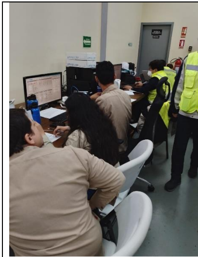
Pruebas en línea