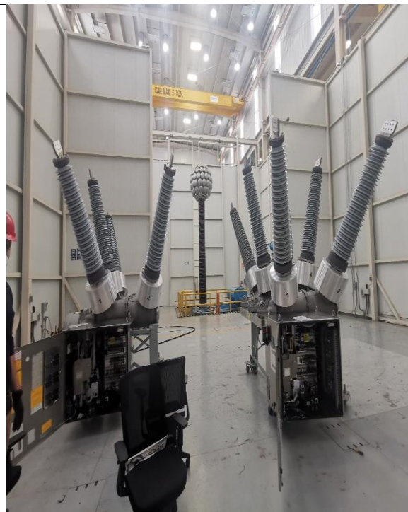
Pruebas de fábrica de los interruptores