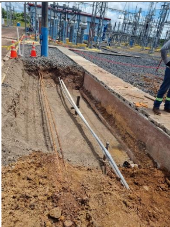
Foto # 5, Relleno y compactación del área de trabajo en la Subestación Llano Sánchez.