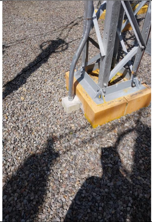
Resane de Acometidas de Sistema de Alumbrado