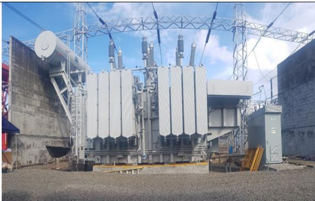
Nuevo transformador T3 armado en su posición definitiva