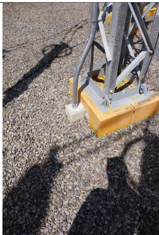
Resane de Acometidas de Sistema de Alumbrado