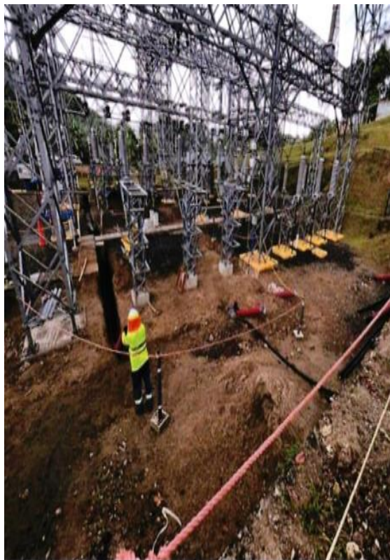
Línea de Transmisión – Vigaducto (0+840 a 0+909)