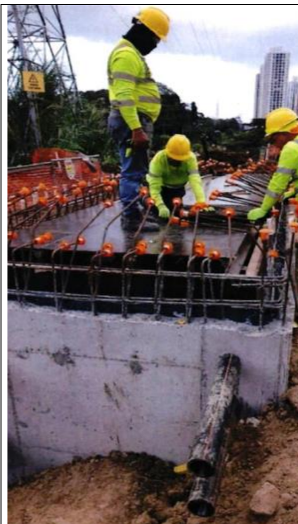
Línea de Transmisión – Cámara de empalme. Colocación de protección de barras de acero