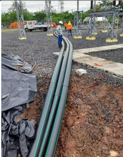
Foto # 3, Preparación de tuberías para los tiros de Perforación Horizontal Dirigida.