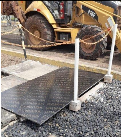
Foto # 9, Reparación temporal de la canaleta afectada en el patio de 115 kV S/E Llano Sánchez.