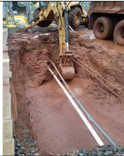
Foto # 6, Maquina perforadora utilizada para la colocación de los tubos.