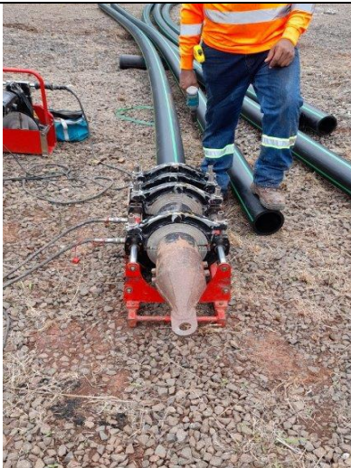
Foto # 1, Preparación de la maquina perforadora para comenzar con los tiros de tuberías.