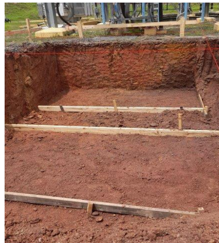
Foto # 10, Excavación del área para construcción de fundaciones de las estructuras metálicas patio 34.5 kV.