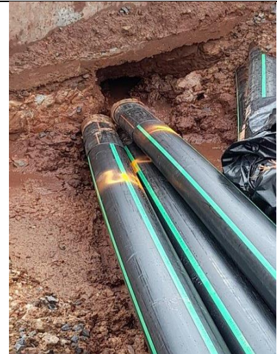
Foto # 4, Vista de tuberías para los tiros de Perforación Horizontal Dirigida.