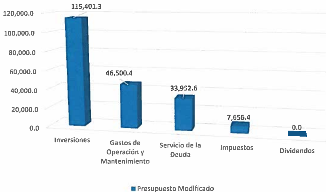
Gráfica No. 1 Presupuesto Modificado a Diciembre 2016