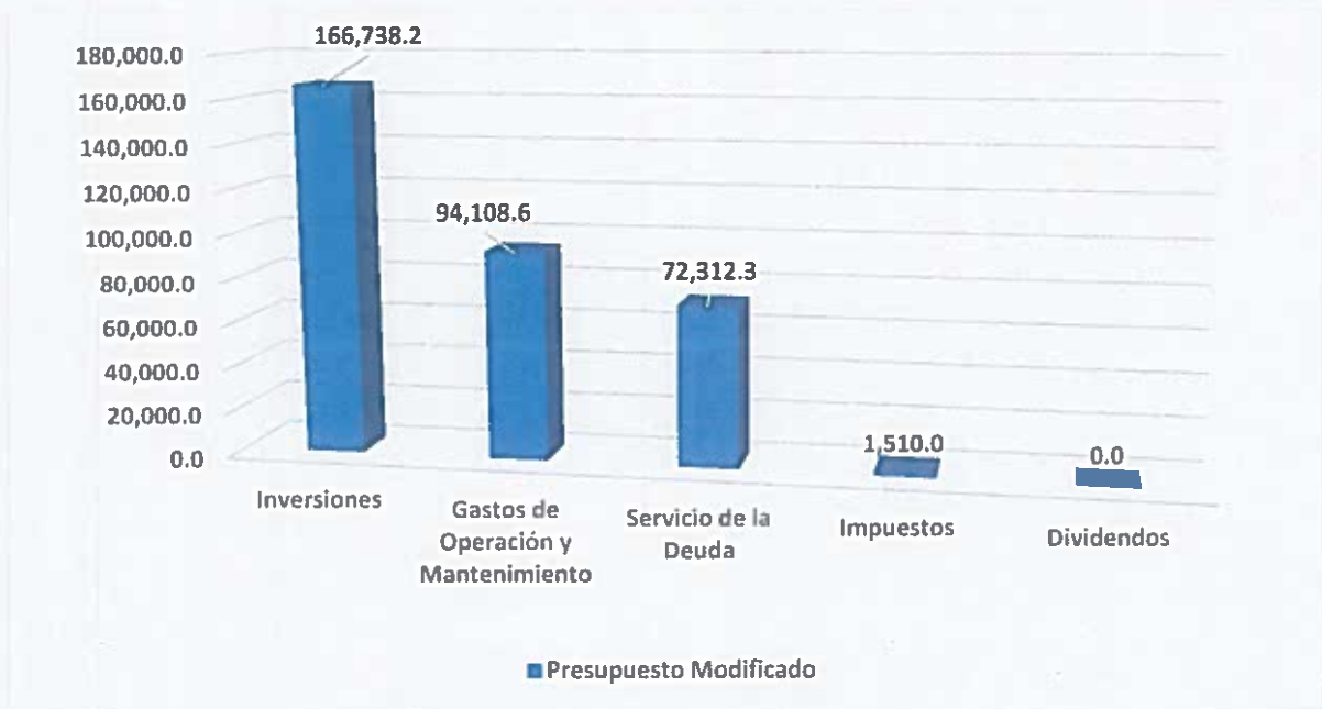
Gráfica No. 1 Presupuesto Modificado a Abril 2019