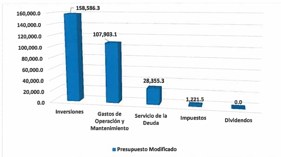
Gráfica No. 1 Presupuesto Modificado al 31 de diciembre 2017