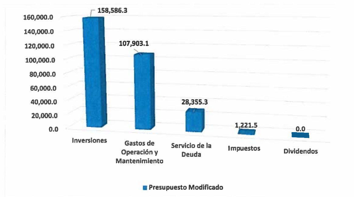
Gráfica No. 1 Presupuesto Modificado al 30 de noviembre 2017