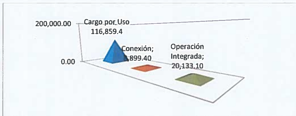
Gráfica No. 2 Distribución del Presupuesto de Ingresos 2018