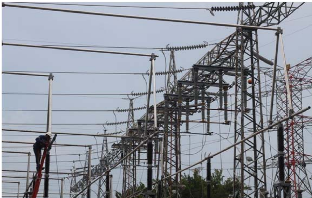
Trabajos de unión de la barra B a la Bahía 6 del Patio de 230 kV