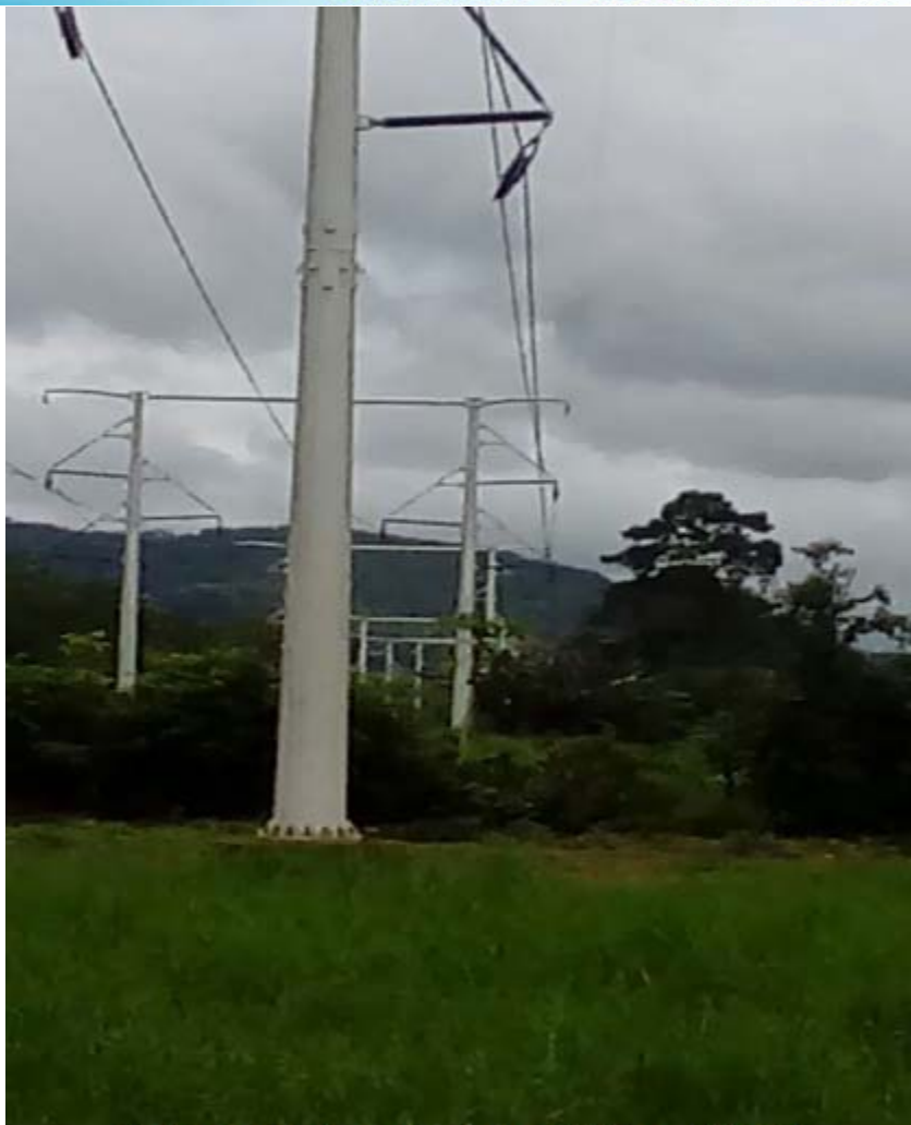
Tendido de conductores en las estructuras PAH. Tramo (105A-108)