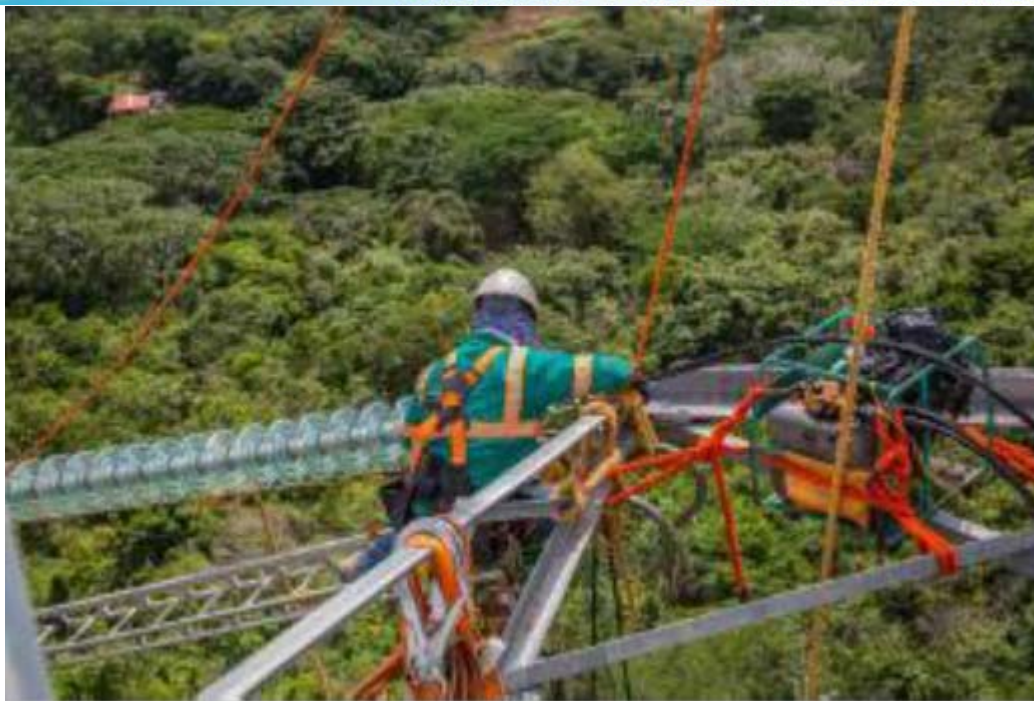
Actividades de Tendido de cables – Tramo 2