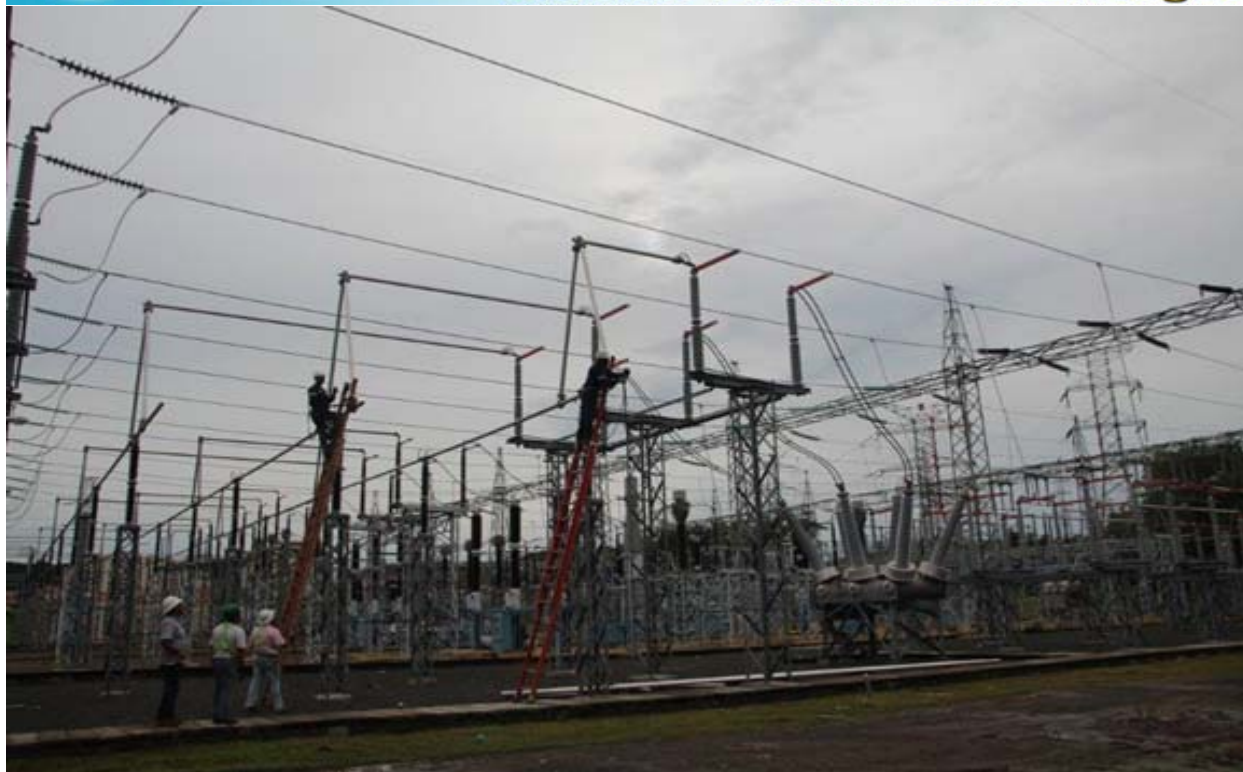
Trabajos de unión de la barra A, a la Bahía 6 del Patio de 230 kV