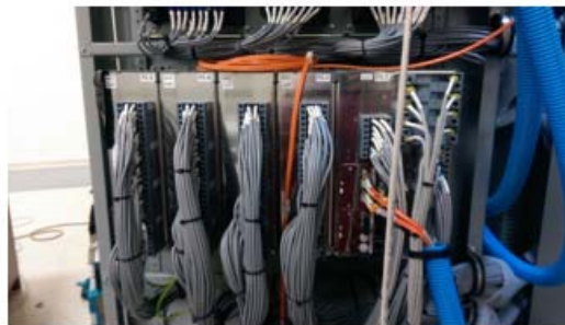
Ubicación de la nueva tarjeta