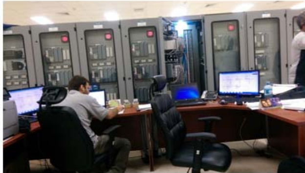
Ajustes configuración de los relés de protección