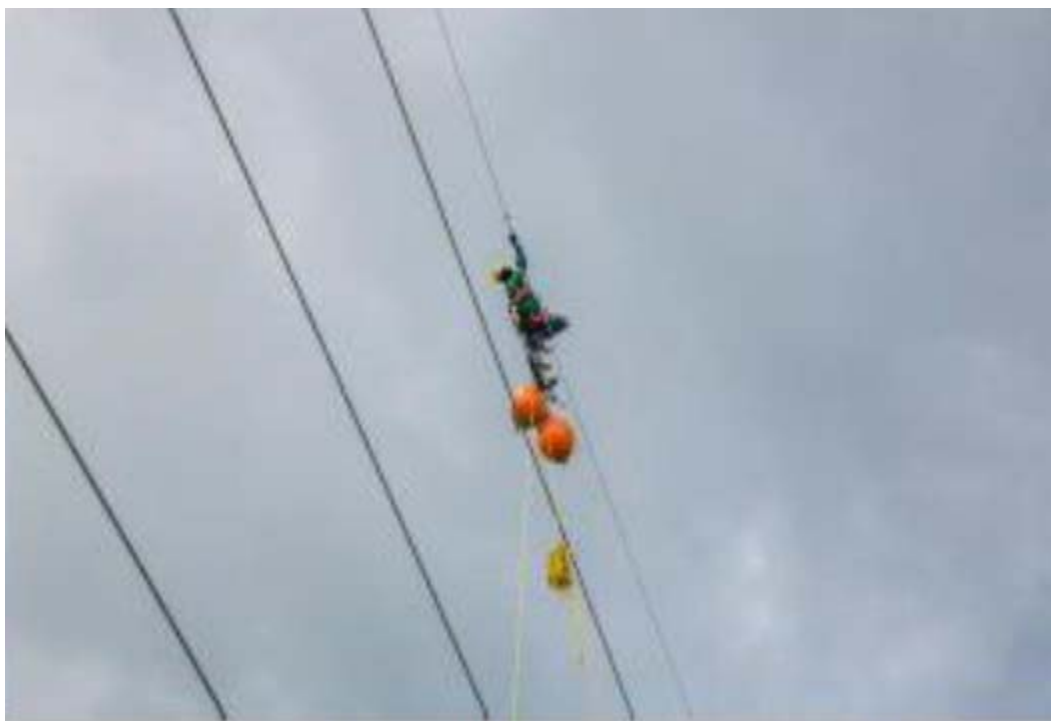
Instalación de Balizas – Torre 347 (TXS2)