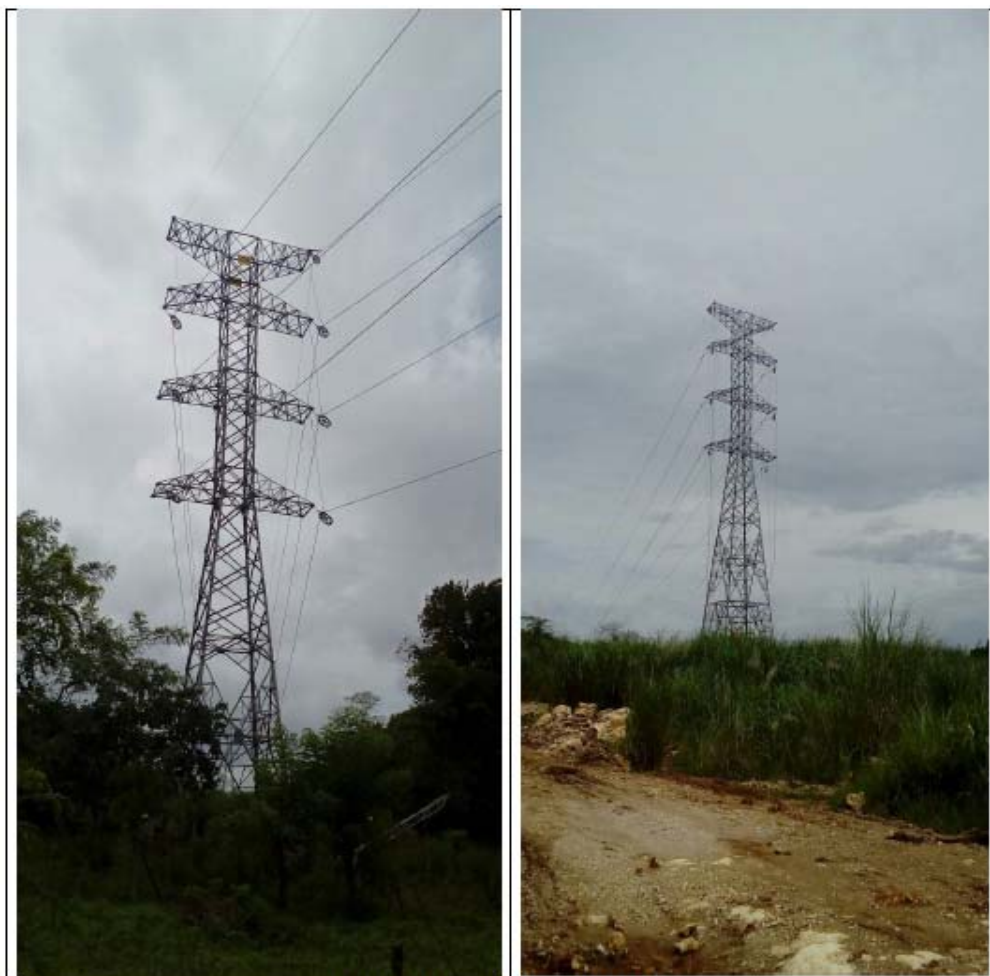
Tendido de conductores 99T – 110T