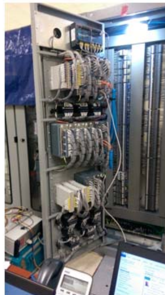
Conexiones para iniciar las pruebas End to End