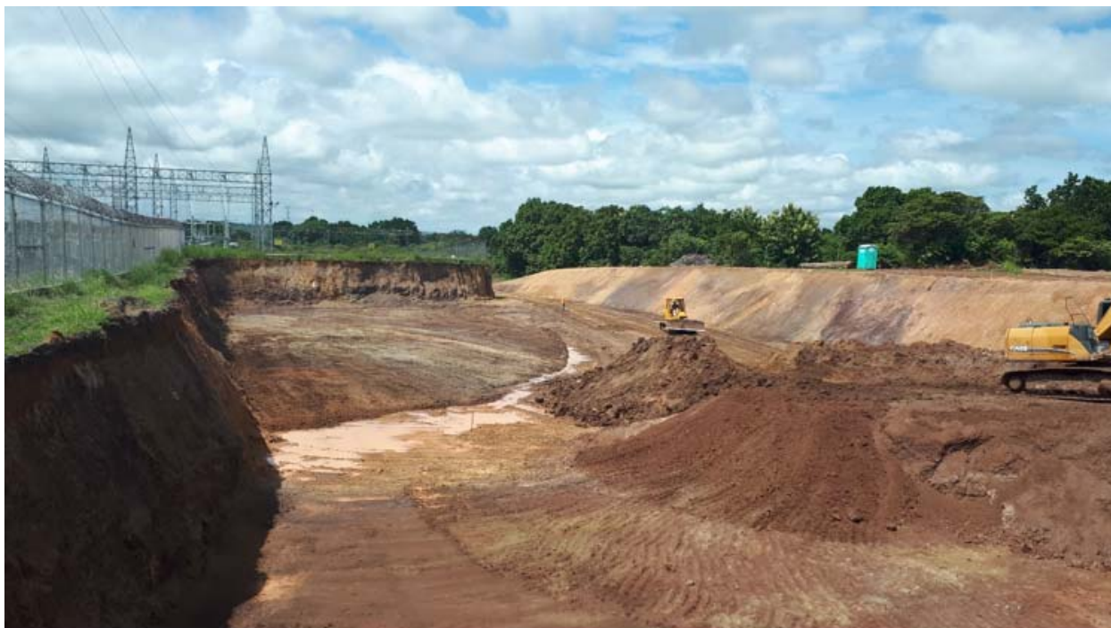
Avance de la excavación en el área de los equipos del SVC – S/E Llano Sánchez