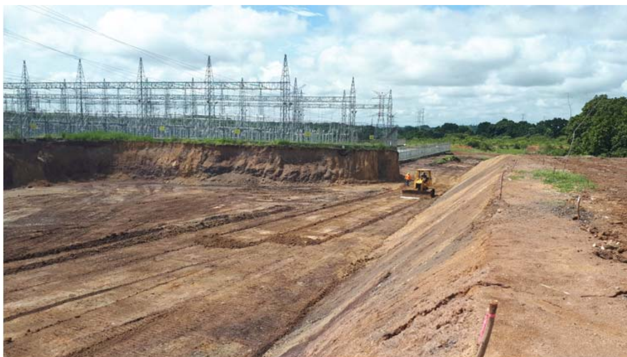
Avance de la excavación en el área de los equipos del SVC – S/E Llano Sánchez