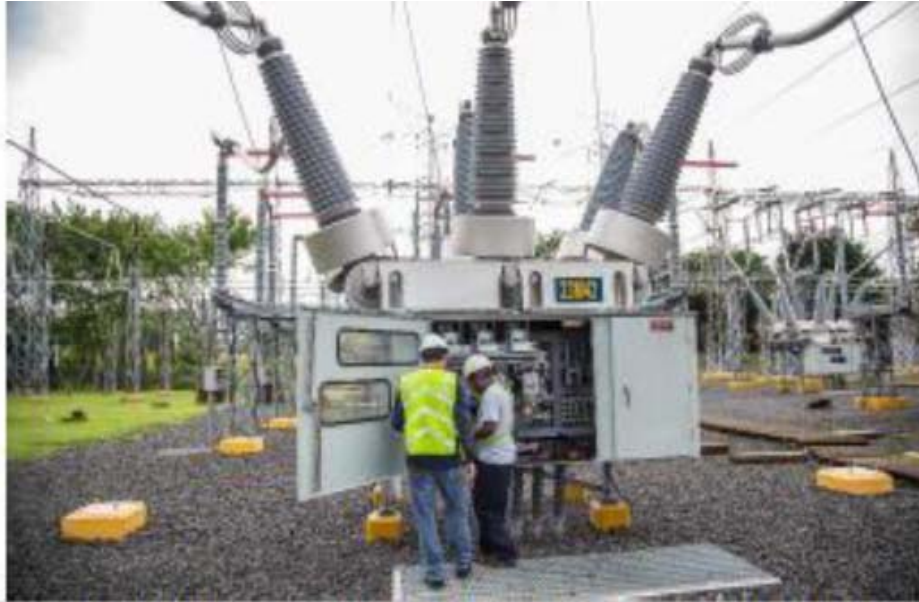
Verificación de Relación de Transformación de los CTs en el Interruptor SE Panamá