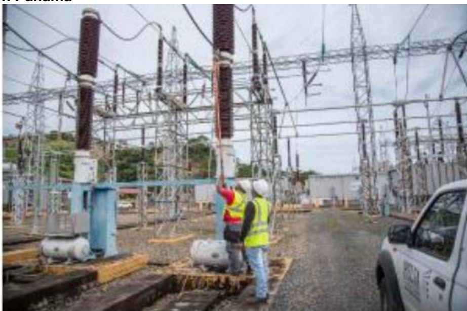
Conexión de Equipo de Inyección para Prueba de Diferencial de Barra A SE Panamá