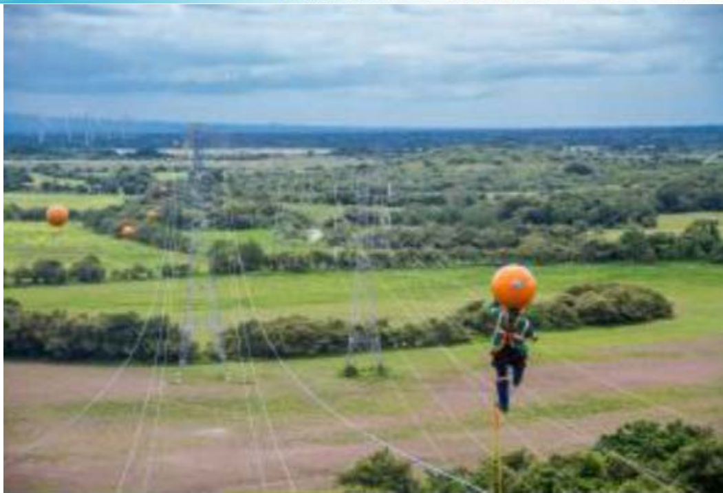
Instalación de Balizas – Torre 437 (TXS2)