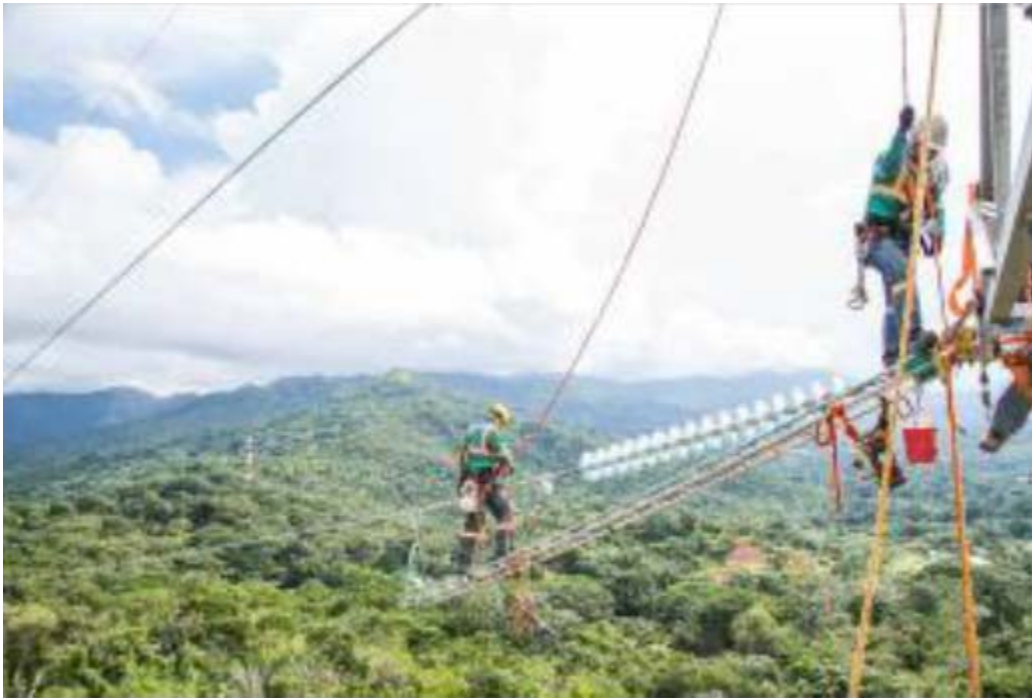
Actividades de Tendido de cables – Tramo 2