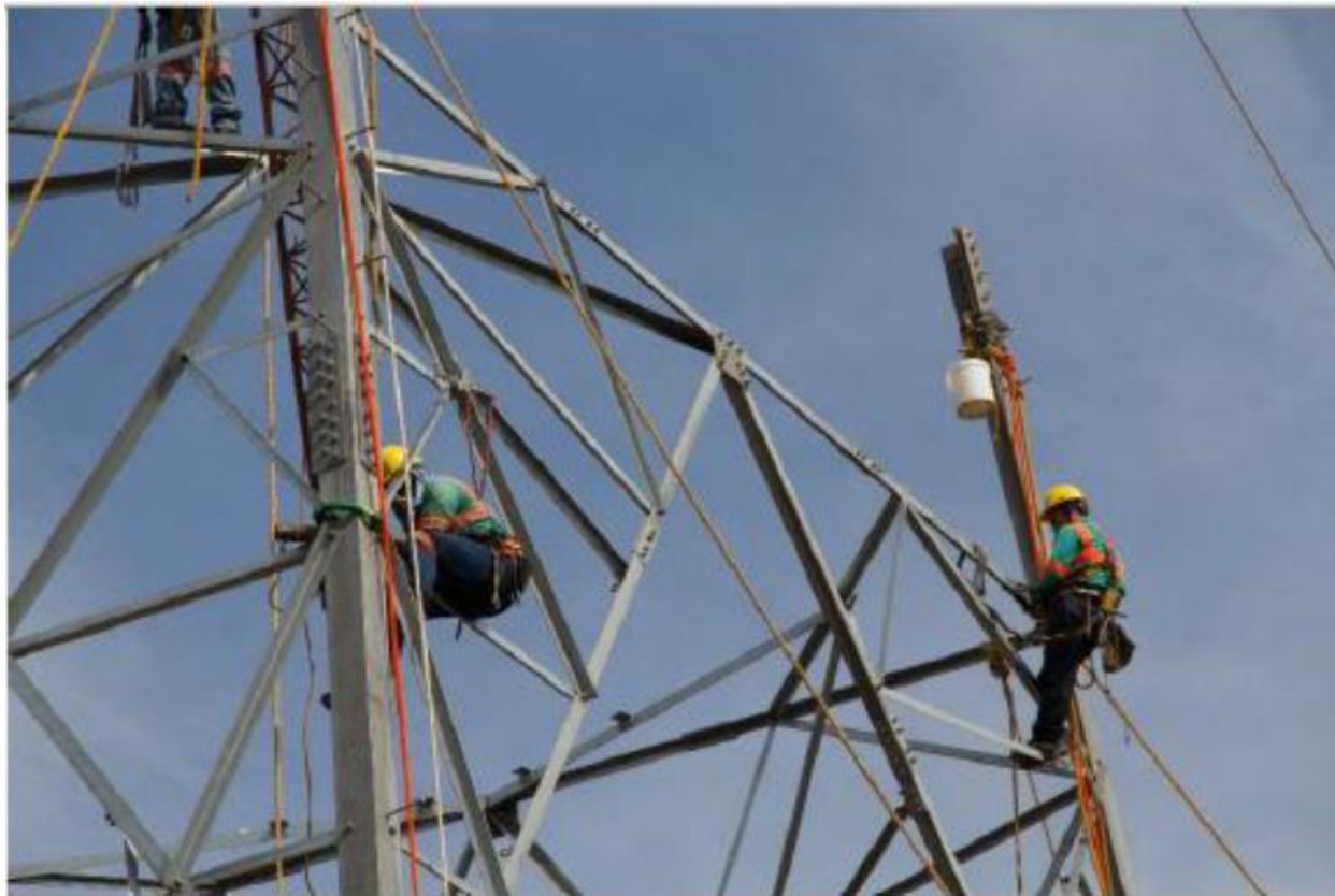
Montaje – Torre 108 (TXE2)