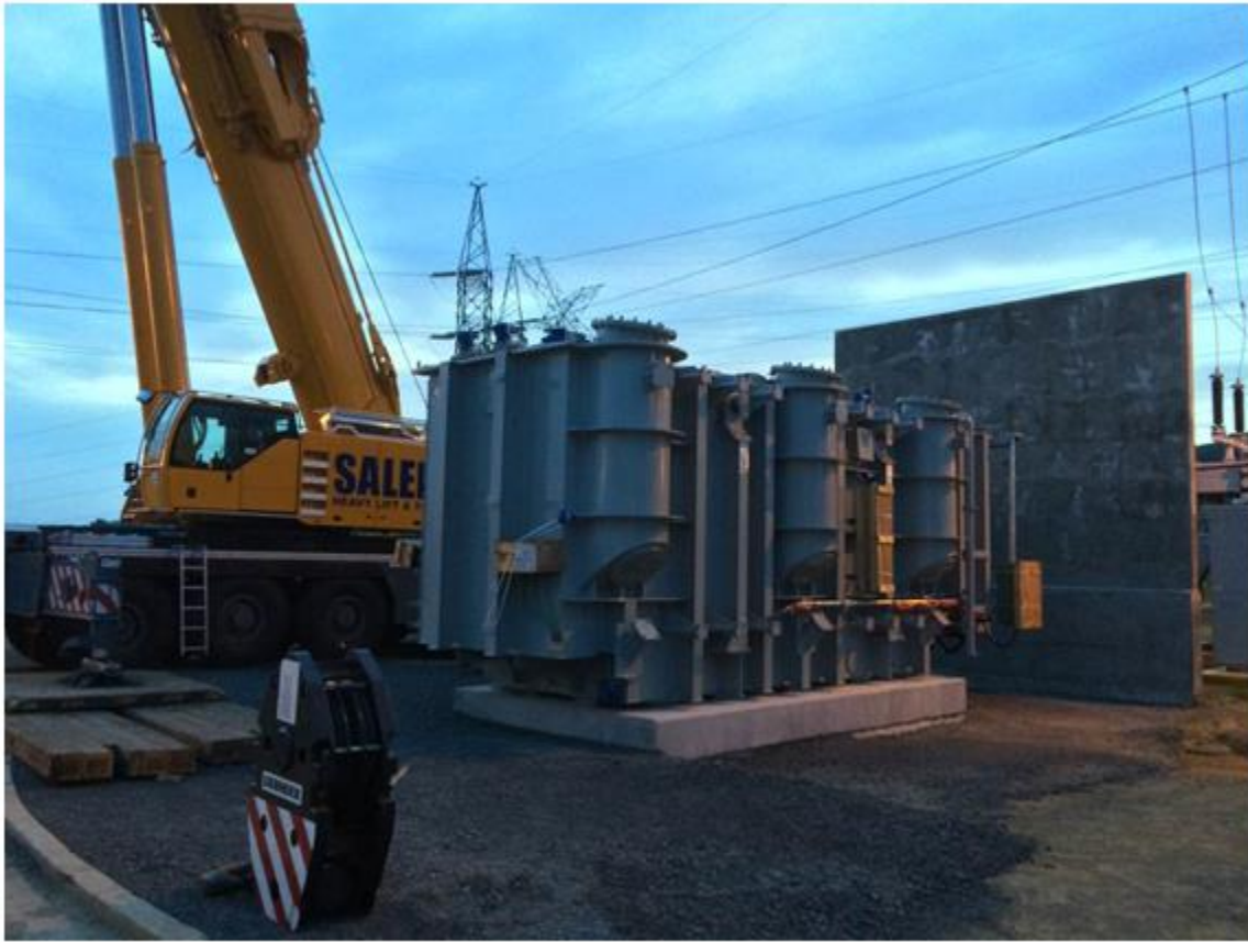
Patio de 230 kV