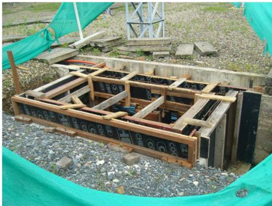
Construcción de cámara de inspección para vigaducto