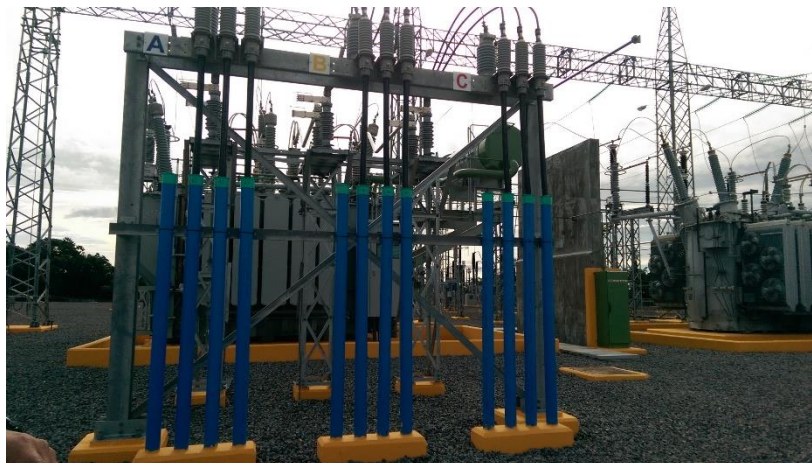
Vista del transformador T2 energizado