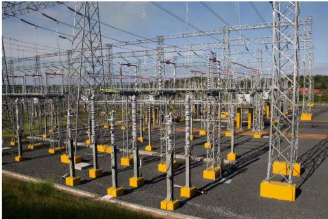
Pintura de Acabado en fundaciones y Equipos – SE Chorrera