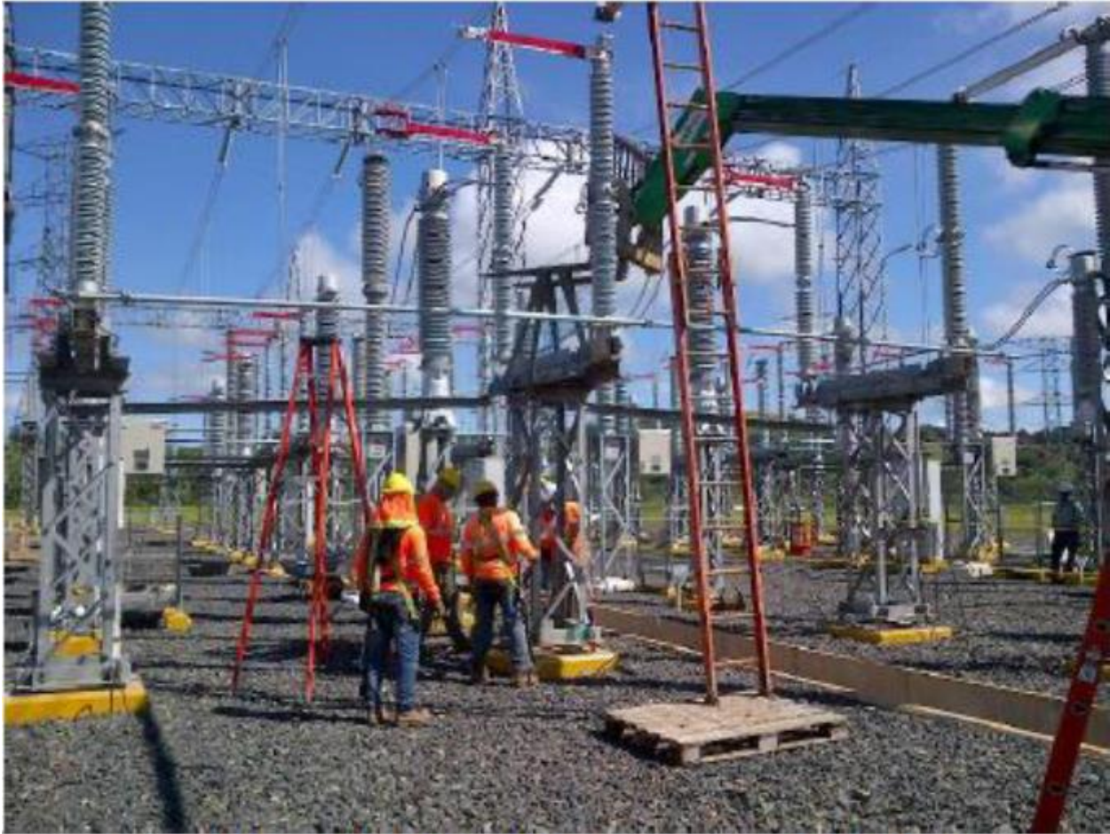
Verificación de Equipos - SE Veladero