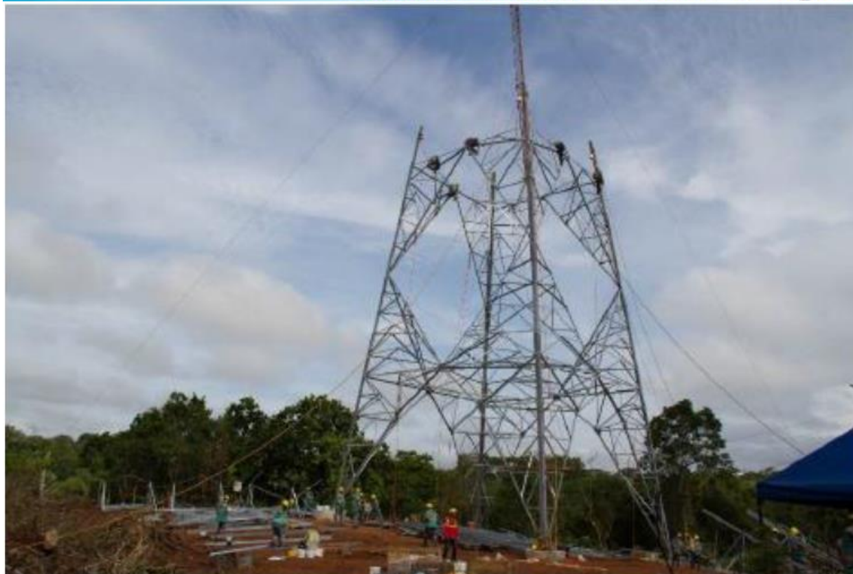
Montaje - Torre 108 (TXE2)