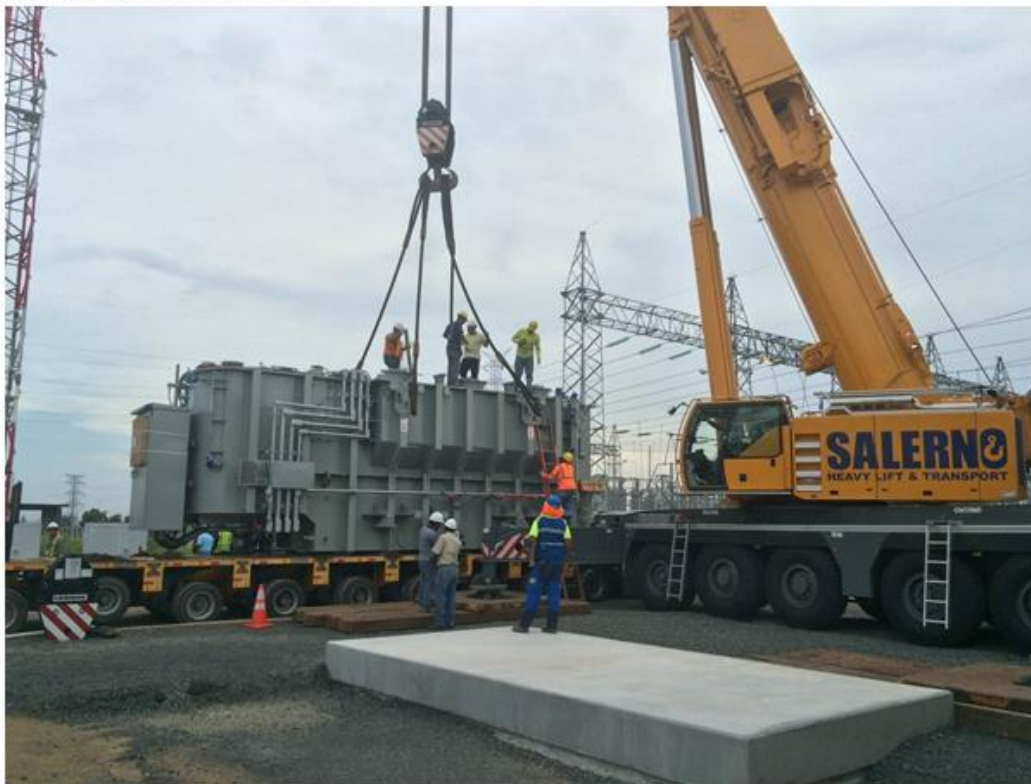
Instalación del Transformador 3.