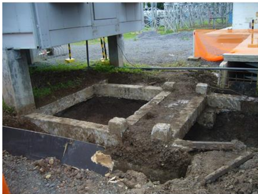
Excavación de cámaras de mantenimiento para los shelters