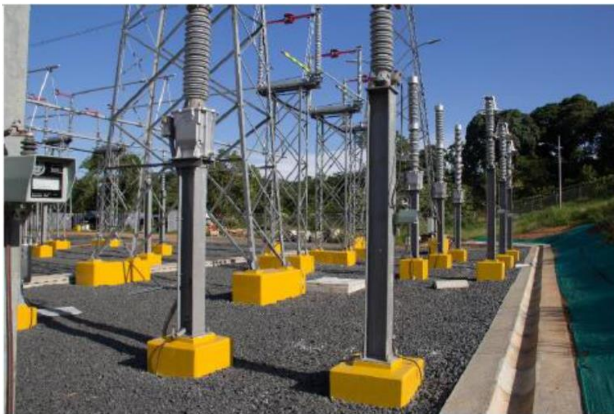
Aisladores y Soportes de Barras – SE Chorrera