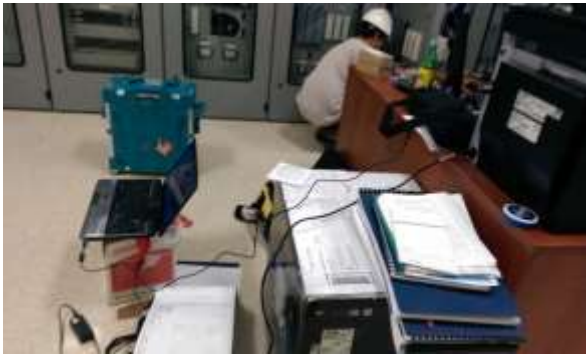
Equipo de inyección secundaria para las pruebas