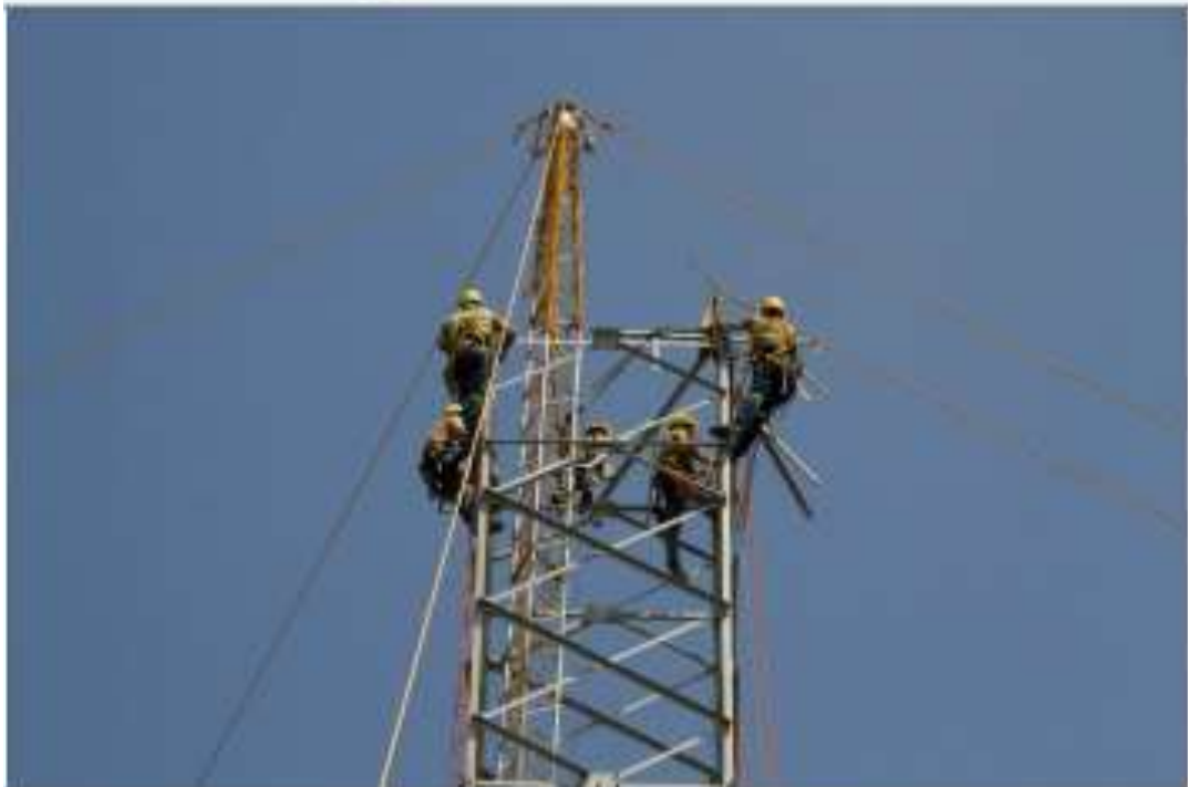
Montaje de Torres – Torre 512 TXA1