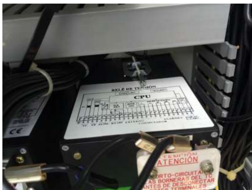
Hacinamiento a lo interno de los Gabinetes de AC y DC.