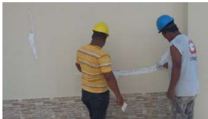
Reparación de paredes externas de casa control SE San Bartolo