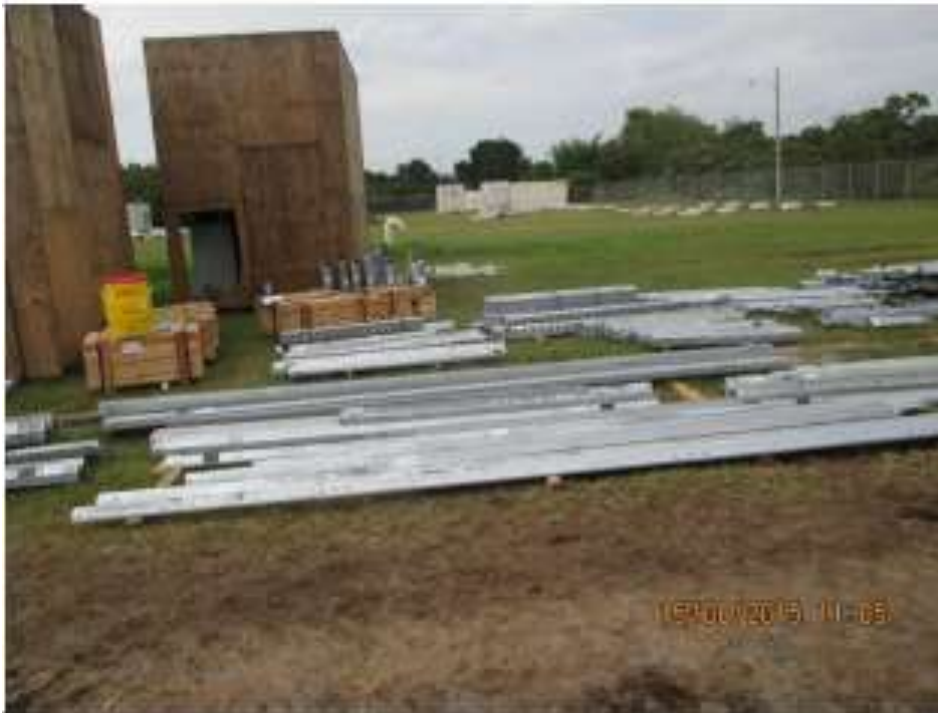
Suministro – SE Chorrera