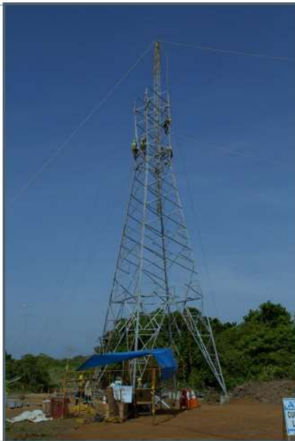
Montaje de Torres – Torre 512 TXA1