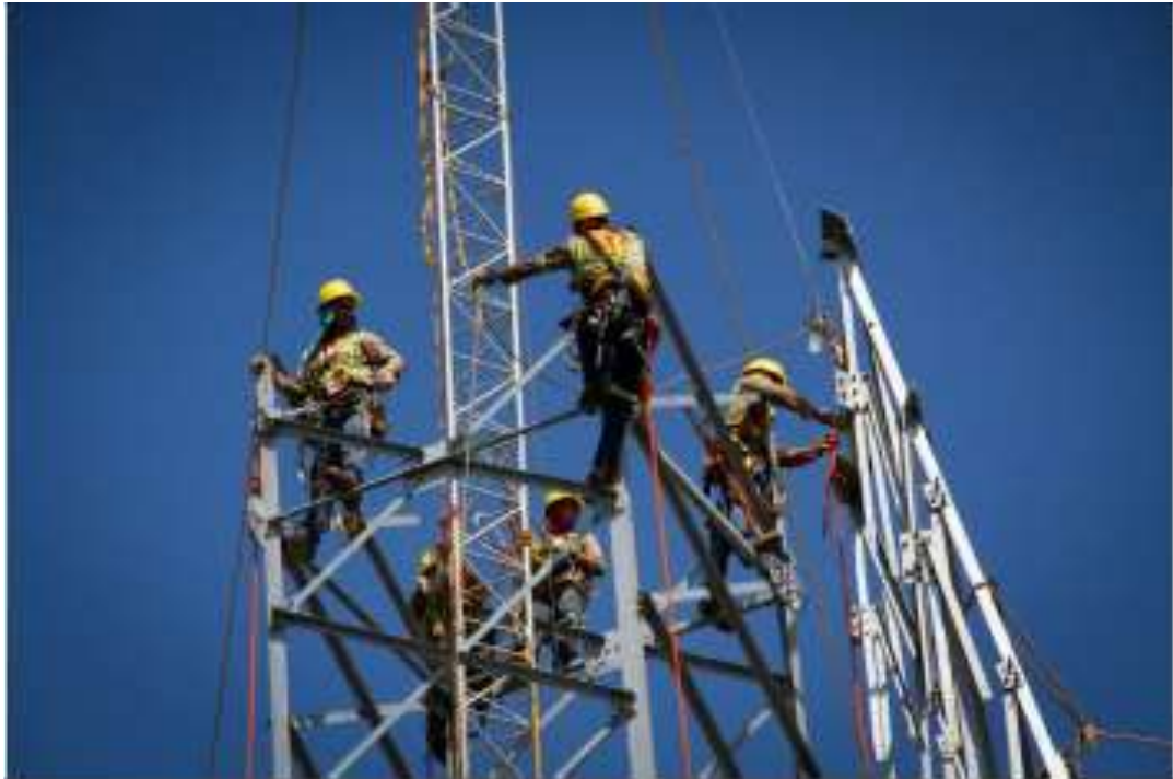
Montaje de Torres – Torre 512 TXA1