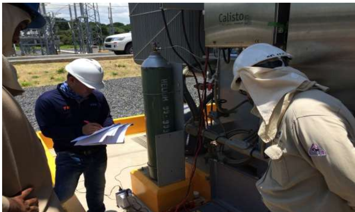
Pruebas de resistencia de devanado al transformador – personal de pruebas de ETESA e ILJIN