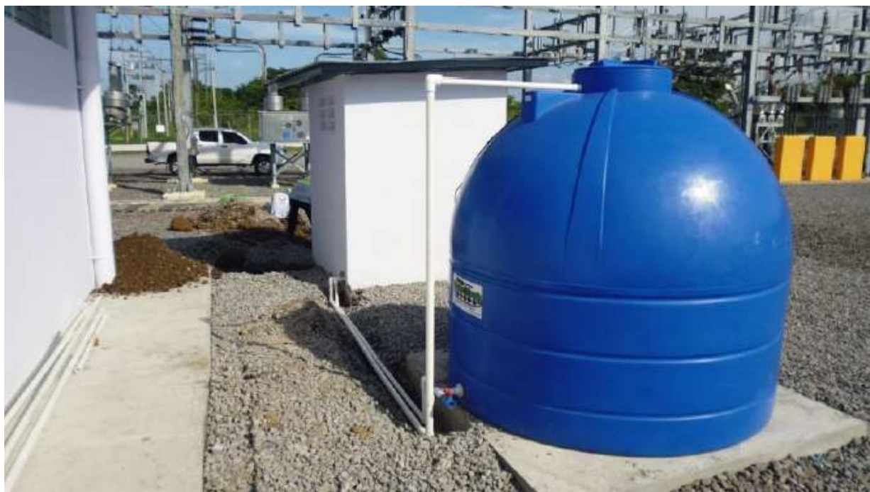
Trabajos de conexión eléctrica del sistema de Bombeo de agua