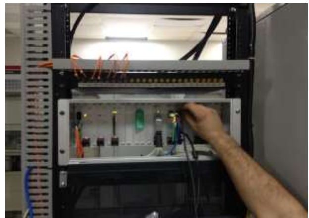
Se terminó de configurar el micro controlador de sincronismo