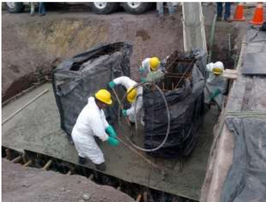
Vaciado de Base de Pórtico – SE Llano Sánchez