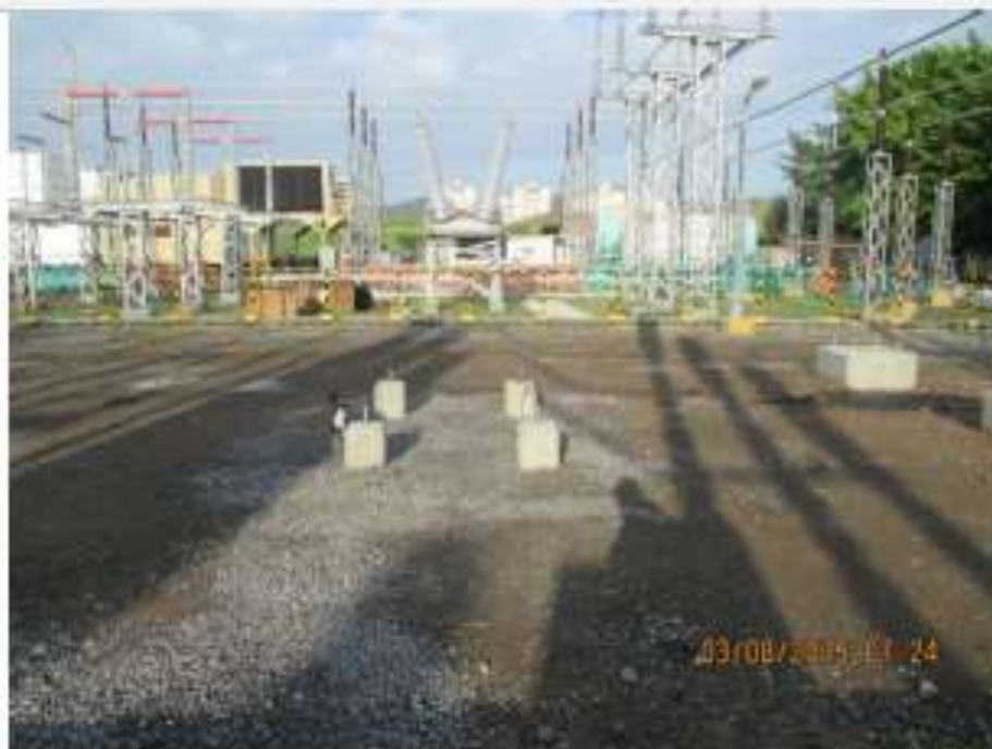
Pedestales Concluidos - SE Panamá