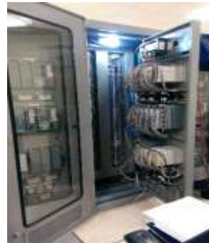
Instalación de las tarjetas