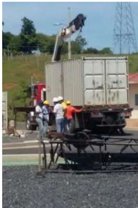
Desmovilización del contratista, patio en General