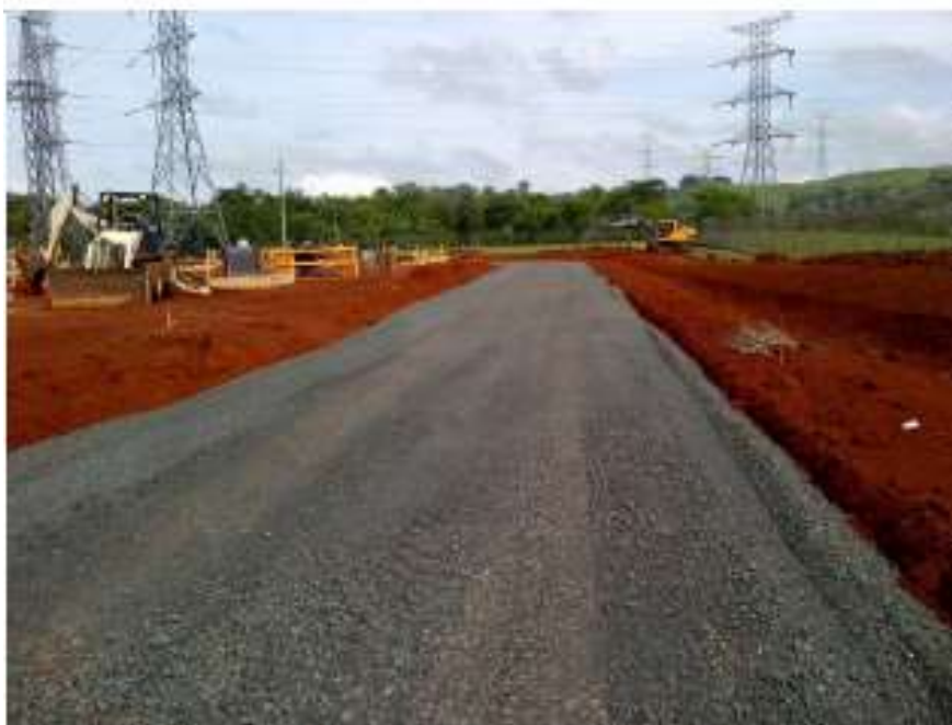
Ampliación de Calle Existente - SE Veladero