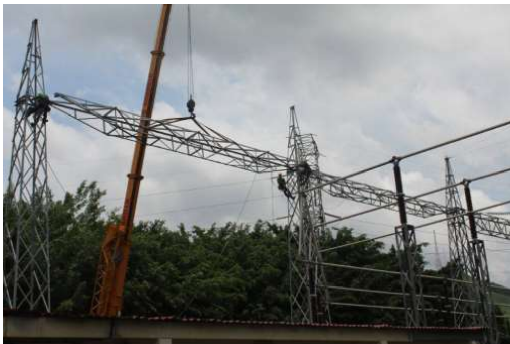
Montaje de la viga entre las torres de pórtico 5B y 4B