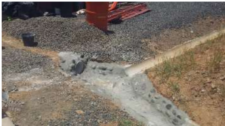
Reparación descarga a media caña para el control del agua