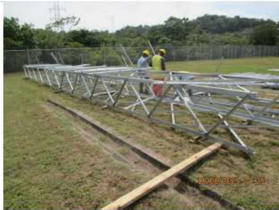
Pre - Armado de Porticos - SE Chorrera