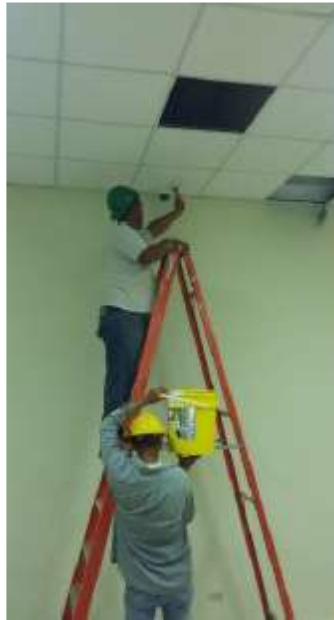
Pintura interna de Casa Control SE San Bartolo