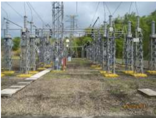
Se llevó señal de voltaje al micro controlador proveniente de la línea 115-28