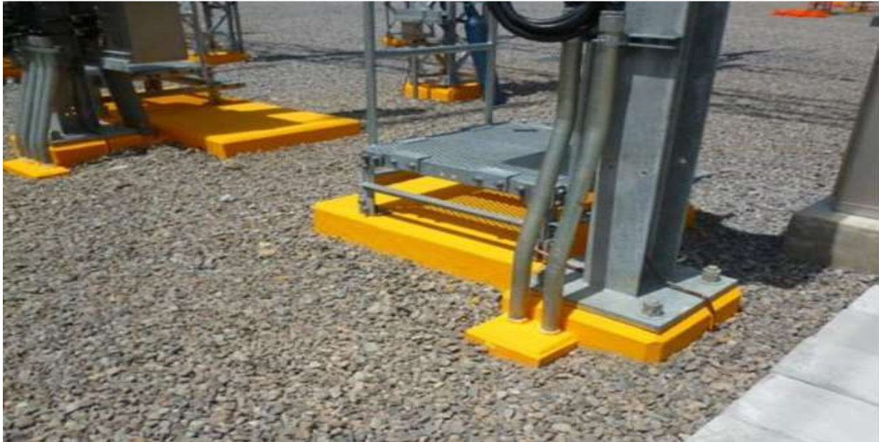
Trabajos de acabado de pintura en las bases de los equipos