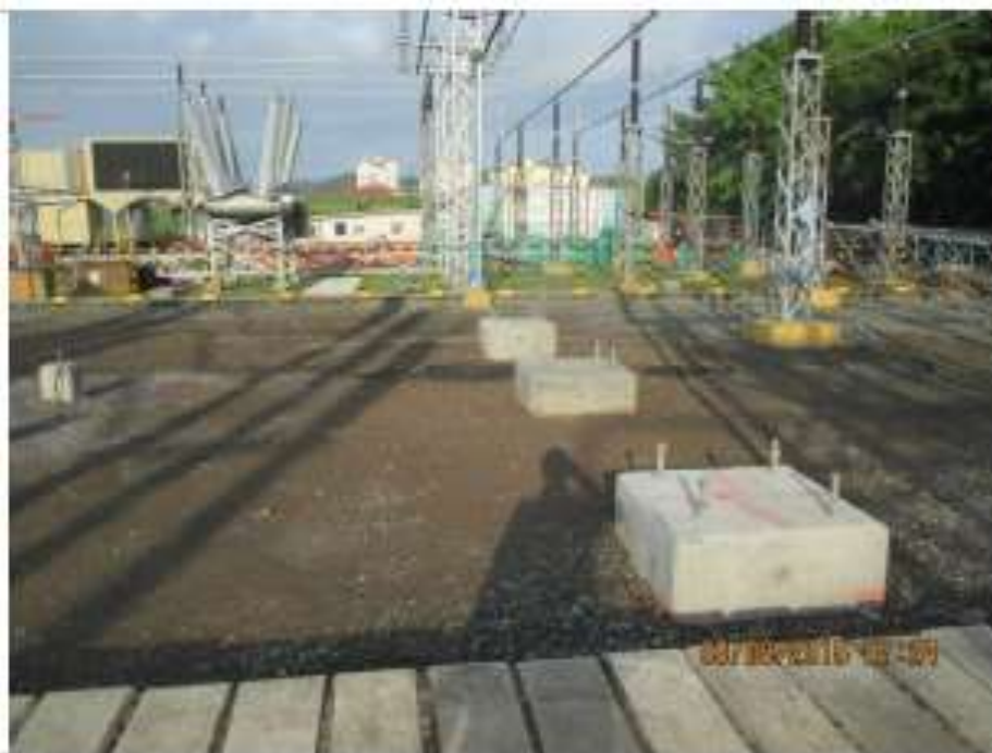
Pedestales Concluidos - SE Panamá