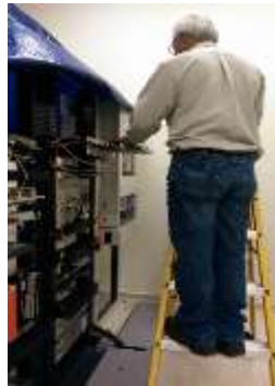
Verificación de la fibra