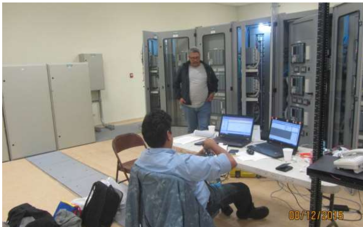
Comisionado de la Subestación – personal de protecciones de ETESA Y SIEMENS