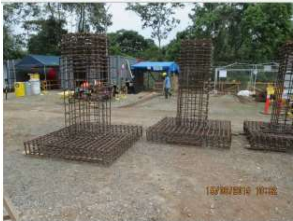
Armado de Acero – SE Chorrera