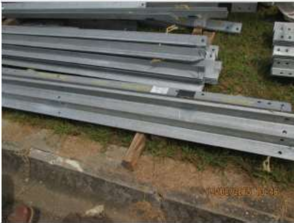
Suministro – SE Chorrera