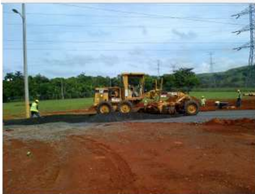
Ampliación de Calle Existente - SE Veladero