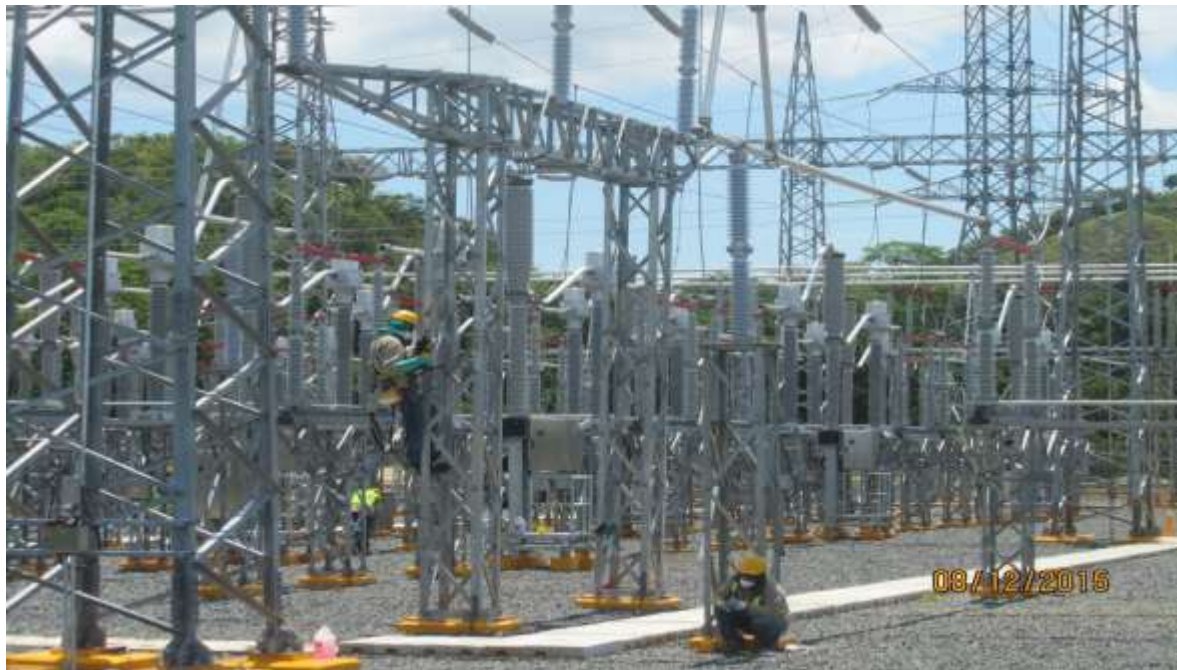
Limpieza de estructuras galvanizadas