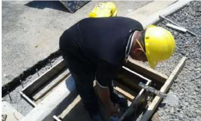
Reparación de estancamiento se realiza un cordón Cuneta SE San Bartolo