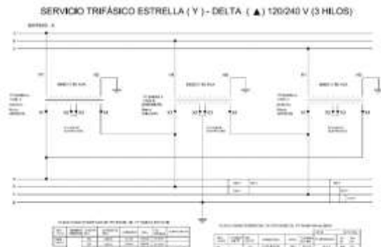
Se aprobó el plano de Conexionado de Transformadores de Potencial.