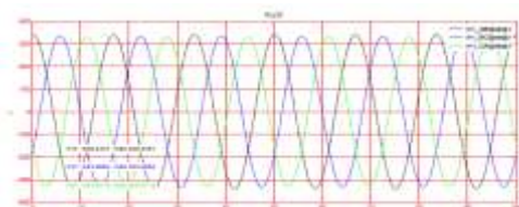
Figura 3. Voltajes de fase a fase en la carga.