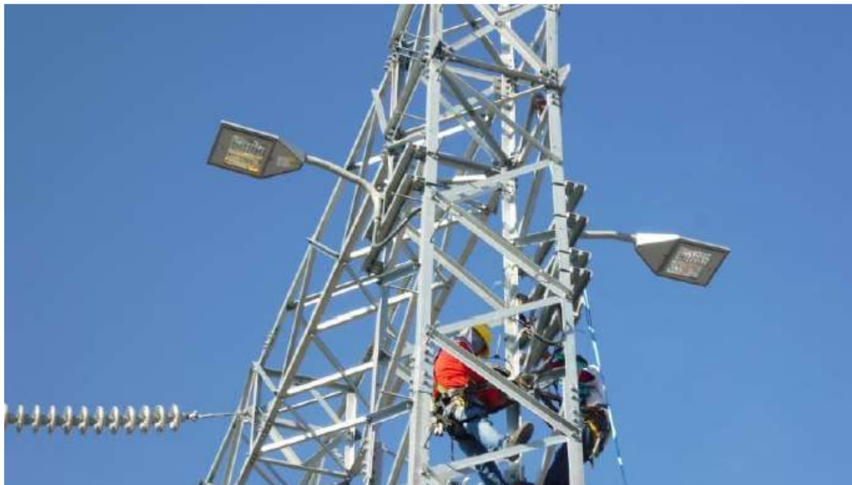
Instalación de luminarias en el patio de 230KV