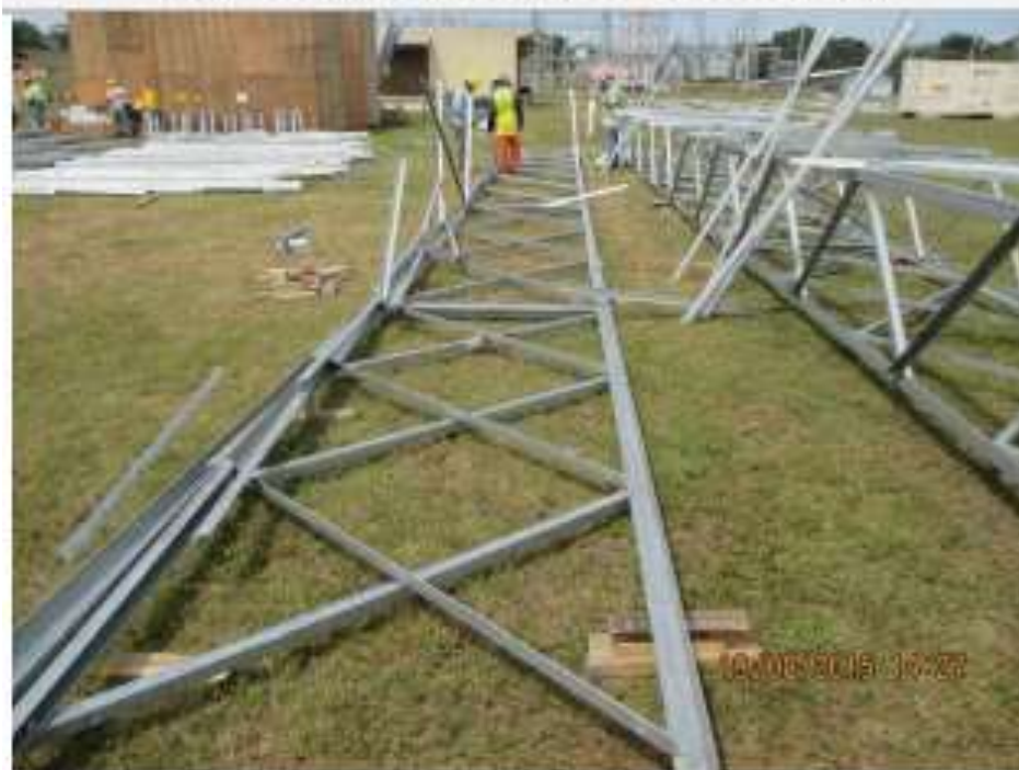
Pre - Armado de Porticos - SE Chorrera