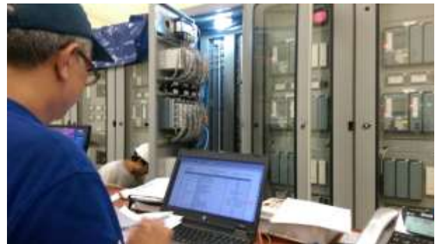
Verificación de los ajustes de protecciones