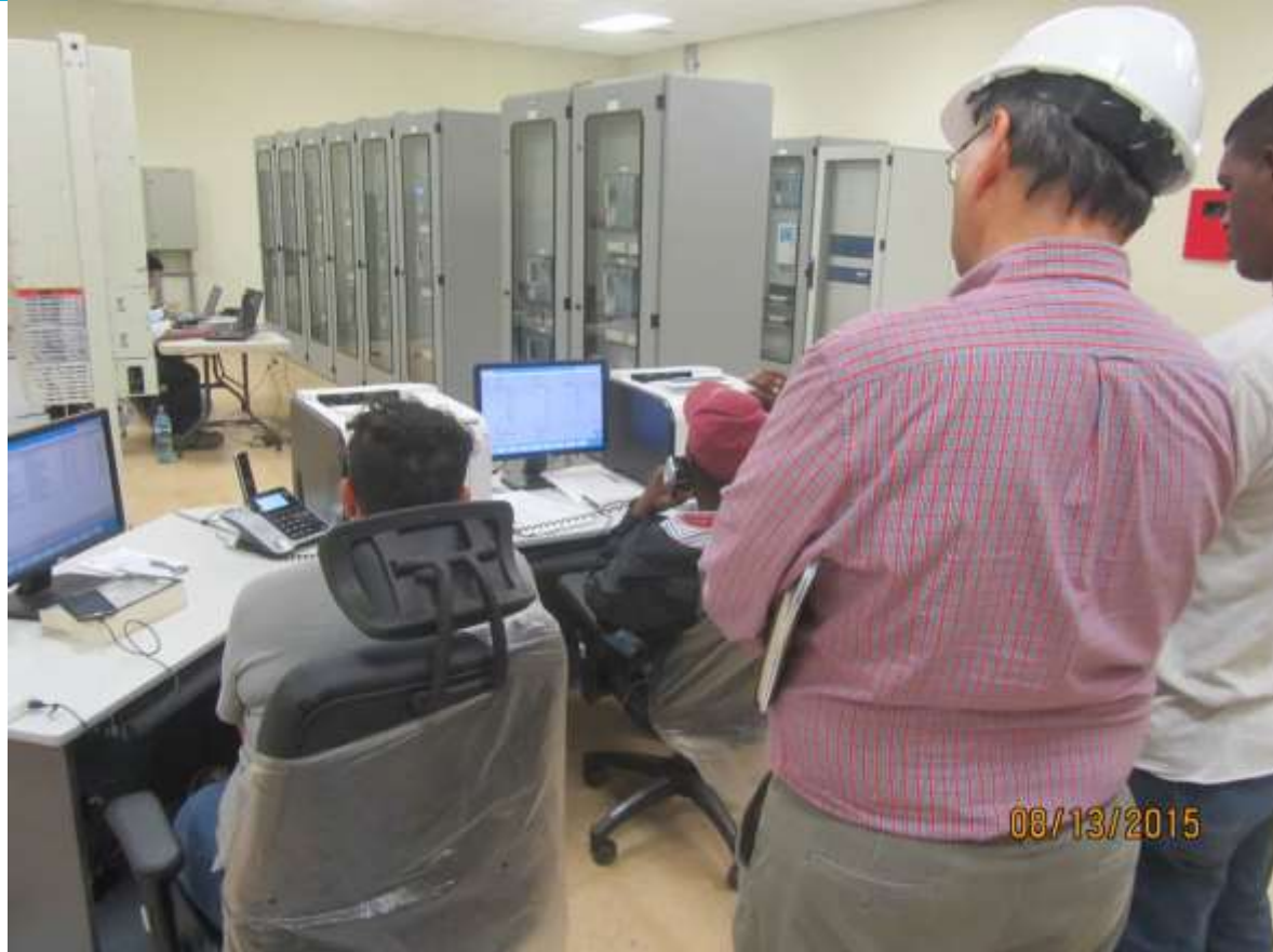
Comisionado de la Subestación – personal de ETESA, SIEMENS Y CELMEC