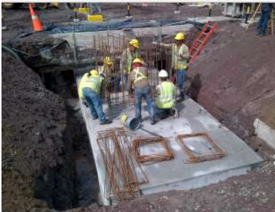
Armado de Acero - SE Llano Sánchez