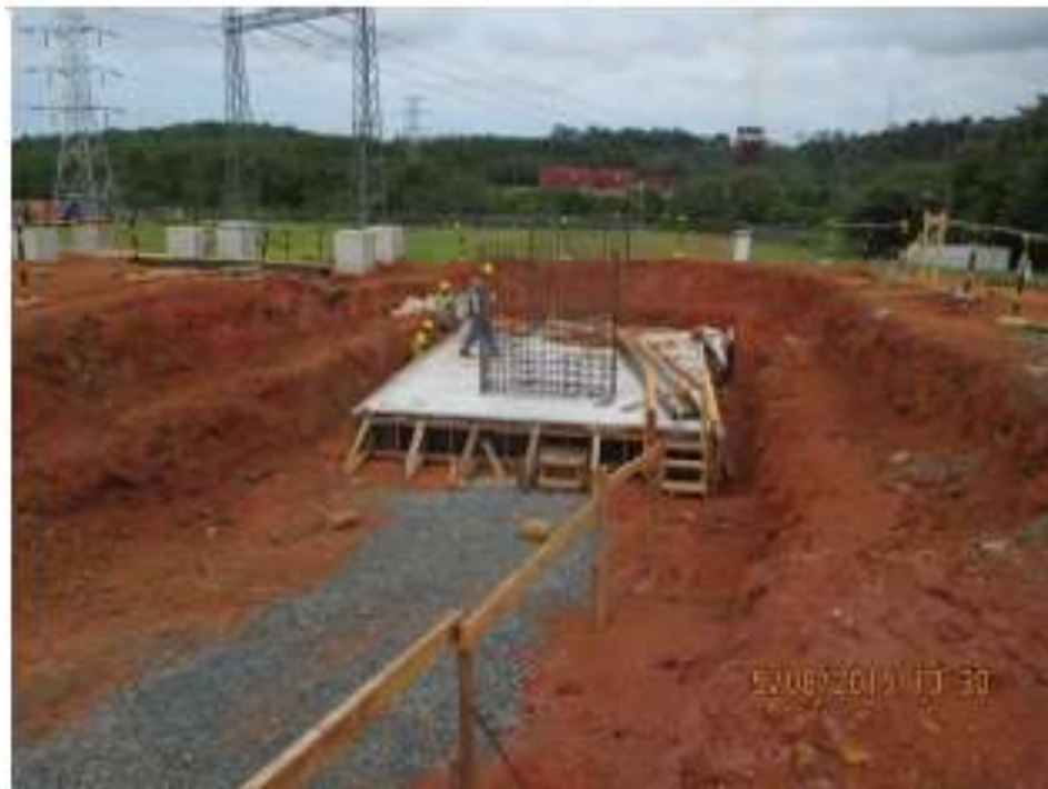
Armado de Acero Pedestal– SE Chorrera