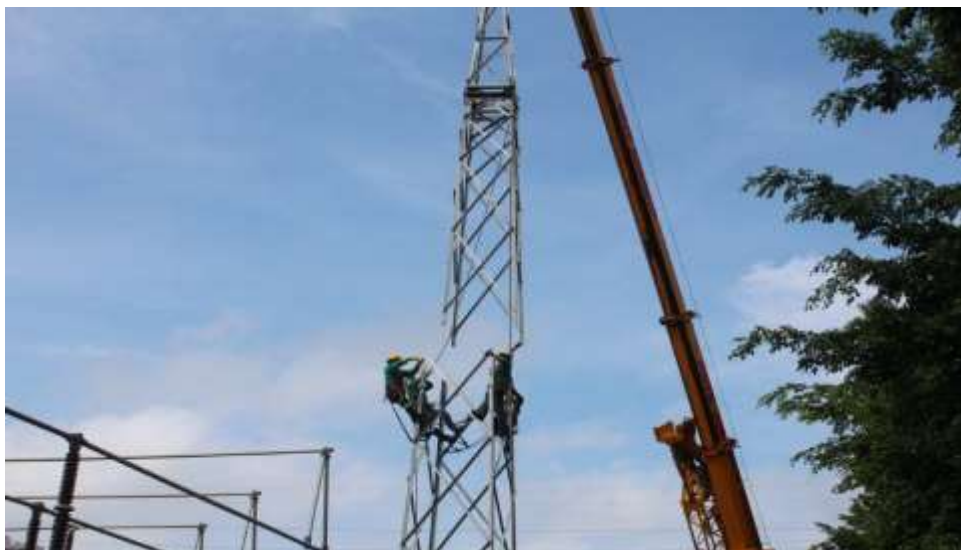
Montaje de la torre de pórtico 5B